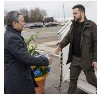
La visite de Volodymyr Zelensky et l'annonce d'une conférence de paix en Suisse ont eu un écho mondial.

et de bons offices est renforcée. La solidarité de la Suisse avec l'Ukraine trouve également un écho dans les médias. De nombreux articles russes critiquent la conférence prévue, notamment du fait que la Russie n'y sera pas représentée. De plus, la légitimité de la Suisse en tant qu'État hôte est contestée au motif qu'elle aurait renoncé à sa neutralité en reprenant les sanctions de l'UE. Selon les médias russes, ces critiques ont également été soulevées dans le cadre d'une rencontre entre le conseiller fédéral Ignazio Cassis et le ministre russe des affaires étrangères Sergueï Lavrov en marge d'une réunion du Conseil de sécurité de l'ONU. Par ailleurs, les médias russes et asiatiques ont relayé à plusieurs reprises l'invitation de la Chine par le conseiller fédéral Cassis. Durant la période couverte par l'analyse, jusqu'à fin mars, les médias occidentaux n'ont évoqué que sporadiquement et objectivement le rôle de la Suisse en tant qu'hôte de la conférence. Ce n'est que lorsque le Conseil fédéral a annoncé début avril que la conférence se tiendrait en juin que le sujet a repris de l'importance, sur fond d'écho médiatique important à l'échelle internationale.