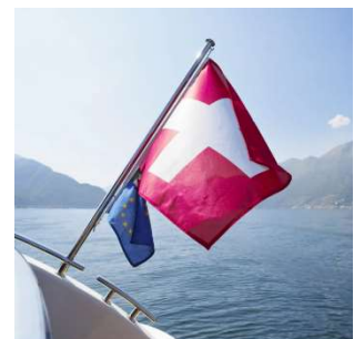
Reprise des négociations entre la Suisse et l'UE

tout au long du trimestre, en particulier dans les pays voisins. Au niveau du volume, la couverture médiatique à l'étranger reste toutefois modeste à l'heure actuelle. Dans leurs comptes rendus majoritairement objectifs sur le paquet d'accords envisagé, les médias soulignent surtout l'utilité économique pour la Suisse. Les médias étrangers estiment néanmoins que les obstacles à franchir sont nombreux pour que les négociations aboutissent, ce en raison de l'hétérogénéité de l'opposition politique interne en Suisse à l'égard d'un accord avec l'UE et de la complexité du système politique.