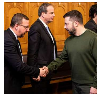
Volodymyr Zelensky en discussion avec des responsables politiques suisses.