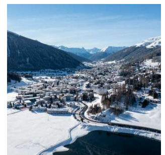
Davos attire l'attention des médias, qui évoque des accusations d'antisémitisme en Suisse.

survenus en Suisse également, comme dans le cas d'accusations d'antisémitisme à l'encontre d'un restaurant d'altitude à Davos. Une pancarte y indiquait que l'établissement refusait que le commerce refusait de louer du matériel de sport aux touristes juifs en raison d'expériences négatives passées. Plusieurs rapports font état de précédents de cette nature dans des régions touristiques suisses. L'attaque au couteau perpétrée contre un juif orthodoxe à Zurich par un jeune Suisse de 15 ans d'origine tunisienne a également eu un grand retentissement. Les articles restent généralement objectifs, et la Suisse n'est pas considérée comme antisémite de manière générale. Certains médias allemands thématisent toutefois une étude selon laquelle les incidents antisémites auraient fortement augmenté en Suisse au cours des derniers mois.