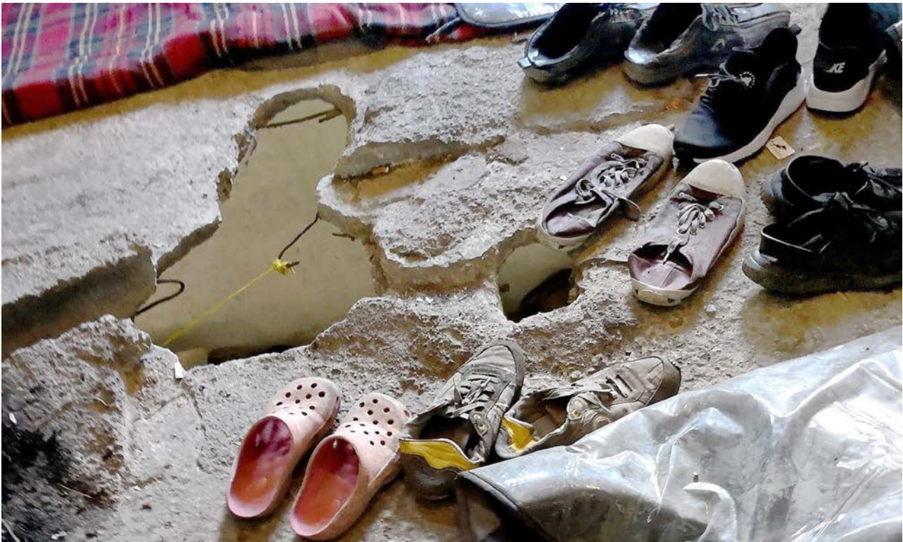
Švicarska podržava pružanje zdravstvenih usluga kako migrantima u zvaničnim prihvatnim centrima tako i onima koji spavaju u spontanima naseljima. Centar Bira kod Bihaca

Švicarska dodana vrijednost u BiH leži u sljedećim oblastima: