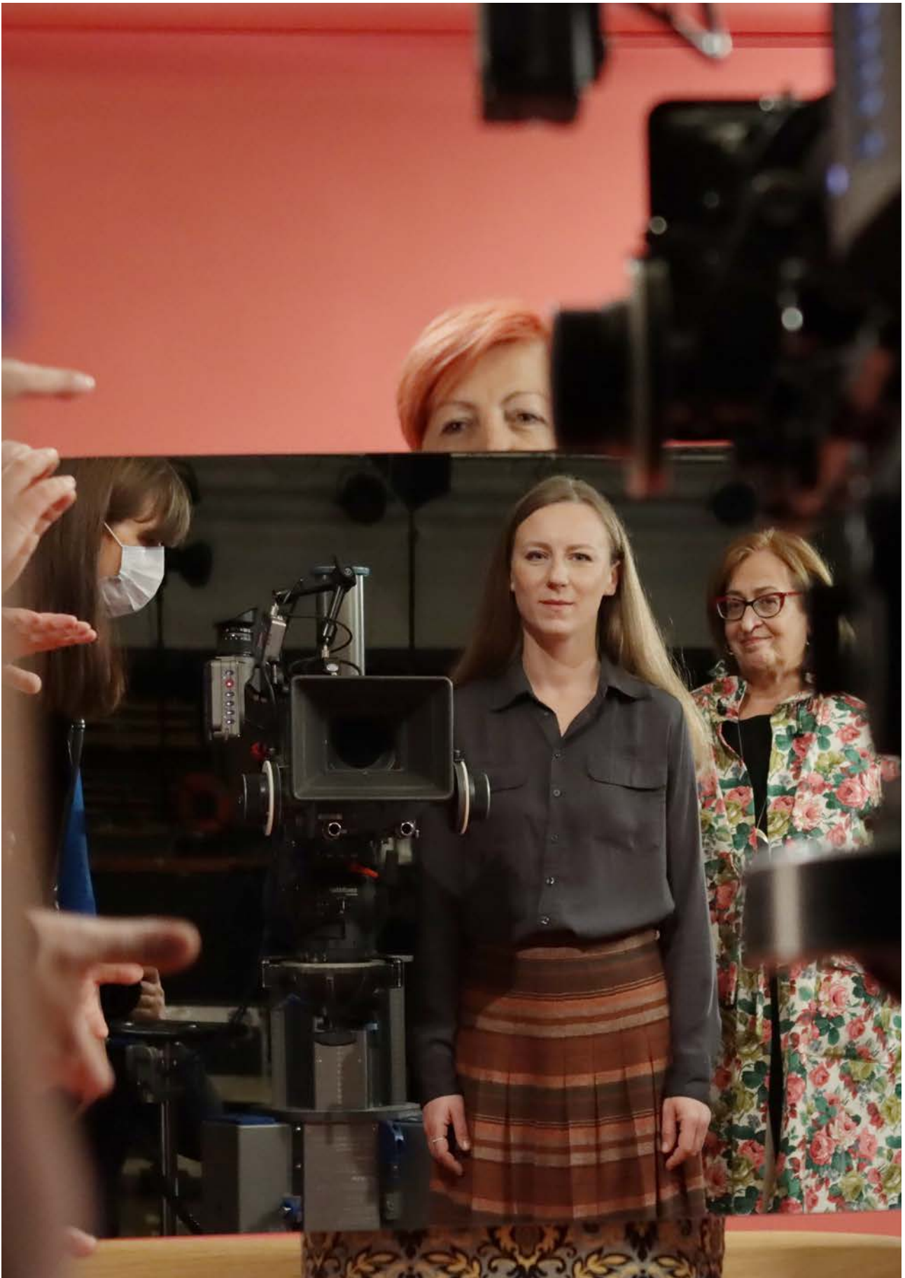
Kampanja „Ja glasam za ženu” promoviše vidljivost žena i njihovo učešće u politici tako što traži od ljudi da glasaju za kandidatkinje na lokalnim izborima.