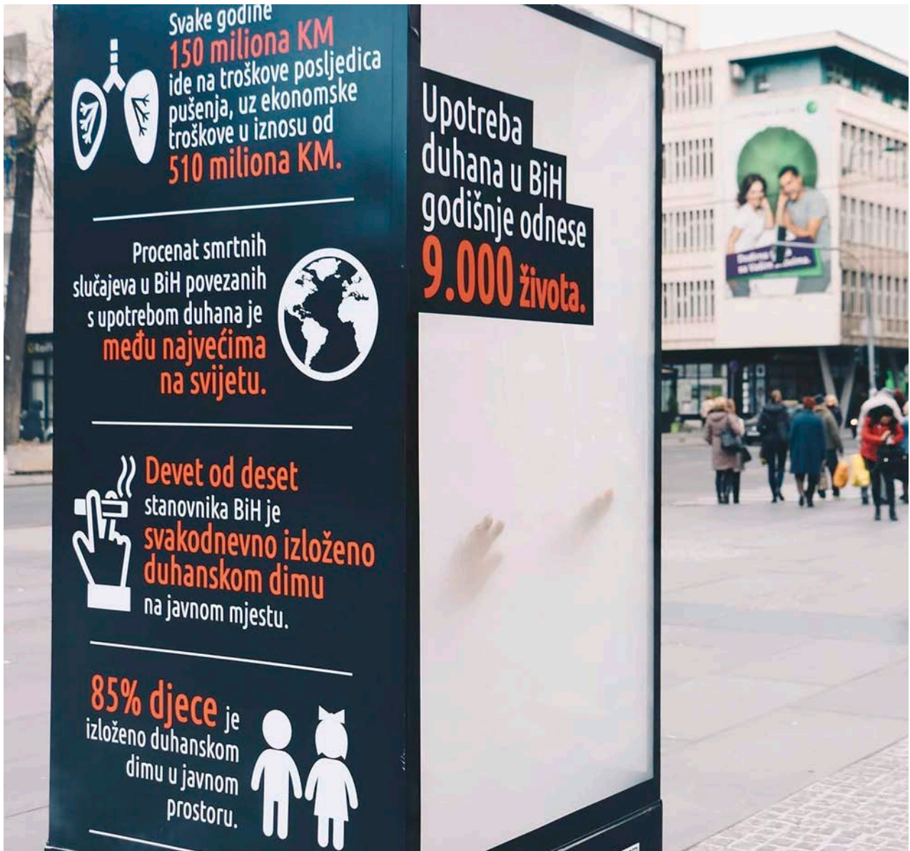
Podizanje svijesti javnosti o važnosti okoline u kojoj se ne puši ima za cilj unapređenje javnog zdravlja. Kampanja „Klima bez dima“, projekt „Smanjenje faktora rizika za zdravlje“