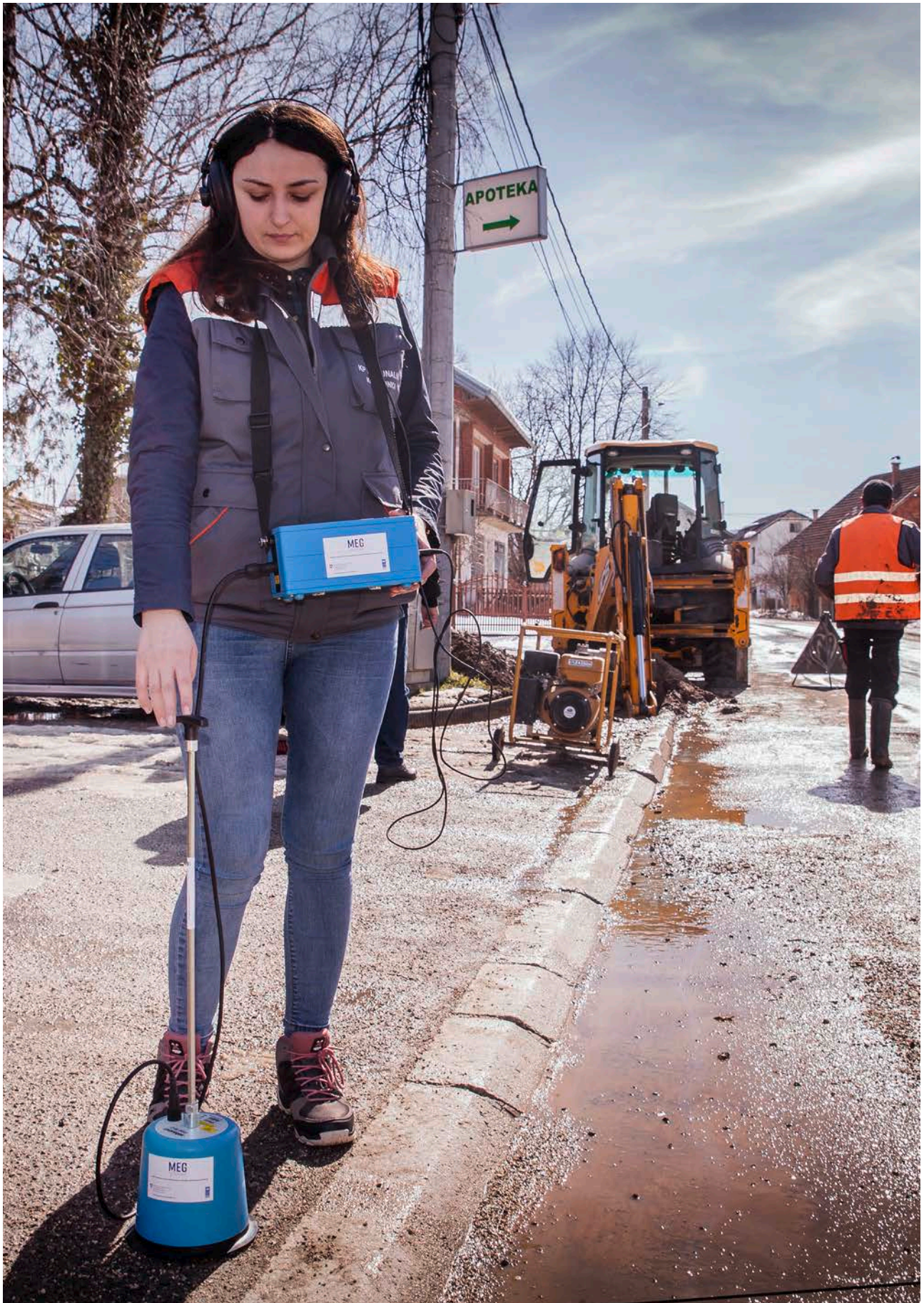
Popravlak vodovodnih cijevi: Organima vlasti se daje podrška u omogućavanju boljeg pristupa vodi za piće i osiguravanju prečišćavanja otpadnih voda. Projekt općinskog okolišnog i ekonomskog upravljanja, Kostajnica