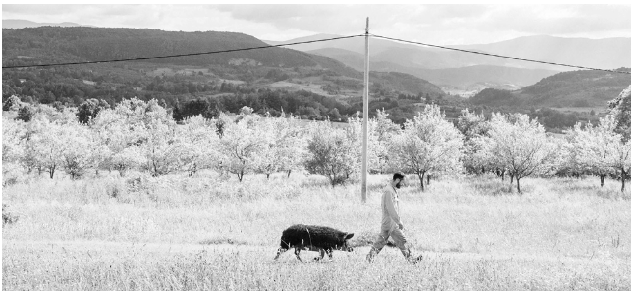
Bolja usluga za pacijente u centrima za mentalno zdravlje u zajednici značajno smanjuje potrebu za hospitalizacijom pacijenata. Izložba „Čovjek je čovjek“, Projekt mentalnog zdravlja