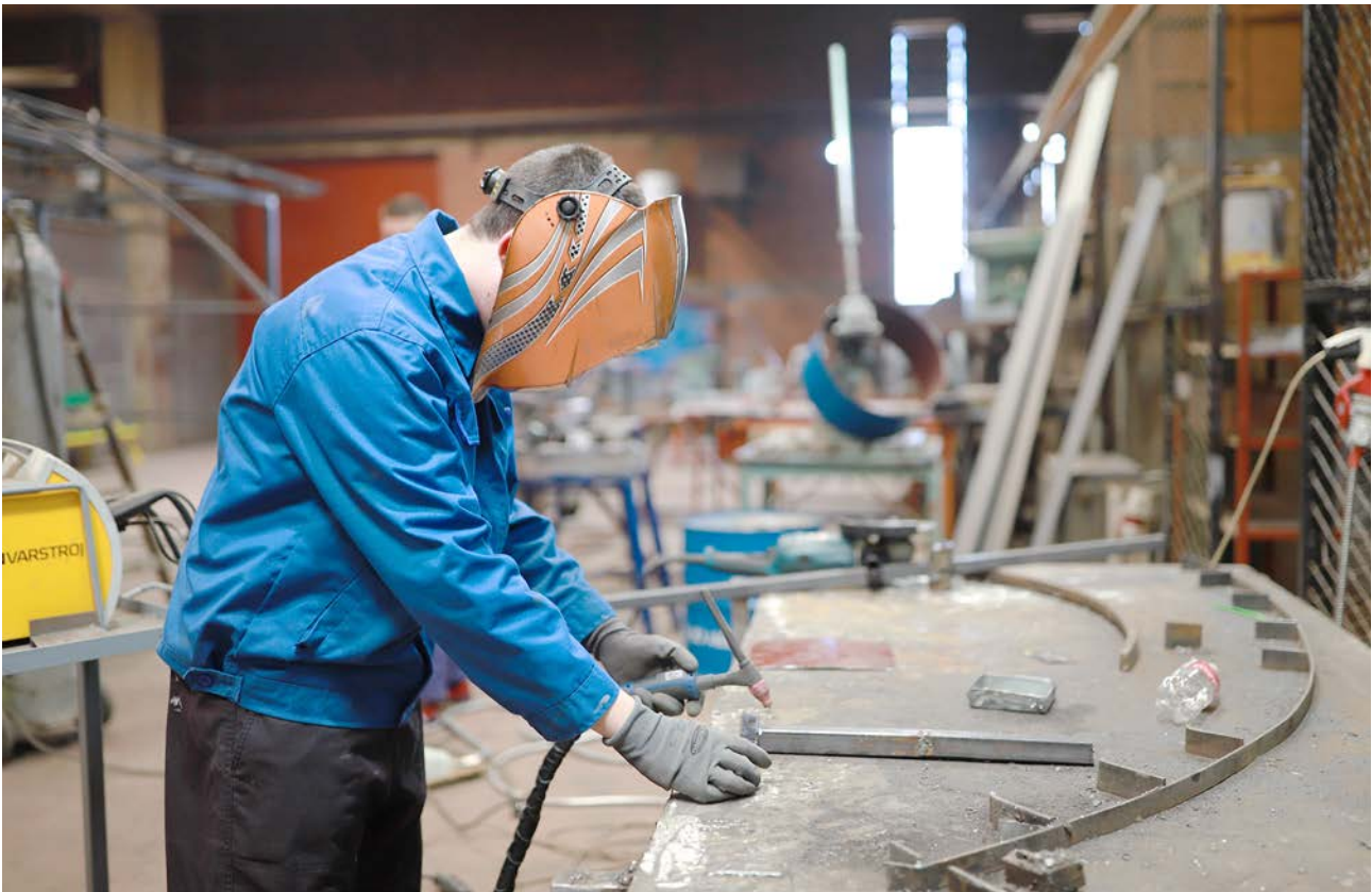
Jačanje stručnog obrazovanja i obuke doprinosi nižoj nezaposlenosti mladih. Projekt „Jačanje stručnog obrazovanja i obuke“, JU Tehnička škola Gradiška

Kroz švicarsku podršku, općine usvajaju sistem upravljanja zasnovan na učincima (PMS), čime operacionalizuju principe dobre uprave u općinama i jačaju socijalnu koheziju. Sistematično će se promovirati korištenje digitalnih rješenja. Švicarska će podržati mjere protiv korupcije i primjenu rodno odgovornih i socijalno inkluzivnih budžetskih pristupa. U sektoru vodnih usluga, uspostavljanje sistema zasnovanog na učincima na općinskom nivou koji uključuje izgradnju kapaciteta vodosnabdijevanja kombinuje se sa reformama regulatornog okvira na višim nivoima. Saradnjom s Programom modernizacije vodnih usluga Svjetske banke, Švicarska će doprinijeti ulaganju u usluge vodosnabdijevanja i prečišćavanja otpadnih voda. Da bi ovo ulaganje bilo održivo, bit će uslovljeno ostvarivanjem napretka u upravljanju kapacitetima i primjeni principa dobre uprave. Švicarska stručnost će se koristiti za izgradnju potrebnih kapaciteta na svim nivoima vlasti vezano za kvalitetno prečišćavanje otpadnih voda. Kroz švicarsku podršku poboljšat će se urbanističko planiranje u Kantonu Sarajevo tako da bude više participativno i da iskoristi švicarsku stručnost. Klimatske promjene će se adresirati kroz ciljane intervencije usmjerene na energetske efikasnije upravljanje otpadnim vodama i infrastrukturom, kao i kroz intervencije za smanjenje rizika od katastrofa. Švicarska će tako doprinijeti nacionalnom cilju BiH koji se tiče reforme javne uprave i plana ulaganja u javno vodosnabdijevanje.