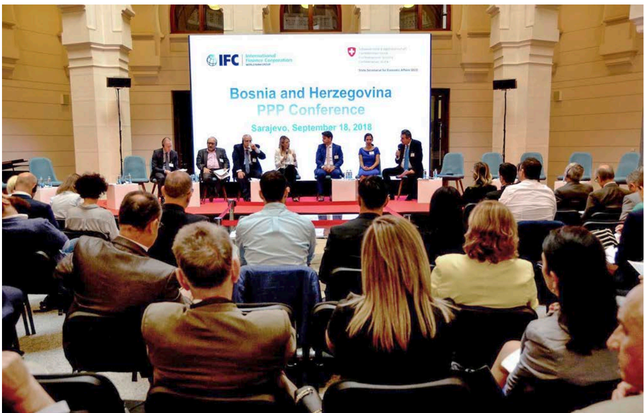
Javno-privatna partnerstva ključna su za postizanje napretka. JPP konferencija, projekt „Javno-privatno partnerstvo“

U provođenju Programa saradnje Švicarske primijenit će se mješavina modaliteta: davanje mandata međunarodnim ili domaćim nevladinim organizacijama (NVO), davanje doprinosa vladinim programima, domaćim i međunarodnim NVO-ima, kao i davanje multilateralno-bilateralnih doprinosa (tzv. multi-bi doprinosa) multilateralnim organizacijama. Kako bi se partnerstva diversifikovala, izvršit će se ponovna procjena obima tzv. multi-bi finansiranja. Uspostavit će se partnerstva za sufinansiranje i tematska savezništva sa drugim bilateralnim donatorima i, ako je moguće, sa švicarskim privatnim sektorom. Nastojat će se ostvariti sinergija između projekata SDC-a