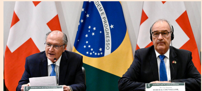
Conselheiro Federal Guy Parmelin em reunião com Vice-presidente do Brasil

Esses acordos demonstram o nosso comprometimento e desejo para uma cooperação ainda mais intensa. A nossa crescente parceria com o Brasil no âmbito da sustentabilidade, se tornou mais forte com o anúncio da Suíça de uma contribuição imediata ao Fundo Amazônia e o começo de uma nova parceria com esse instrumento de grande importância para o Brasil e a região. Essa intensa agenda nos preparara para recebermos em outubro a visita do Presidente da Confederação Suíça , o Conselheiro Federal Alain Berset que visitará São Paulo e Brasília. A sua visita intensificará ainda mais os diálogos com os nossos interlocutores nas novas administrações.