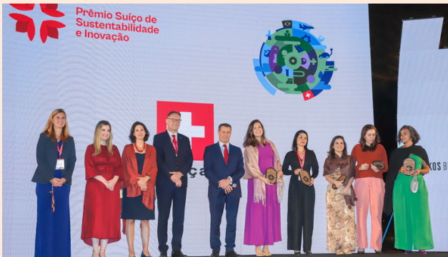
Representantes do Grupo de Trabalho e do conselho empresarial e júri de inovação