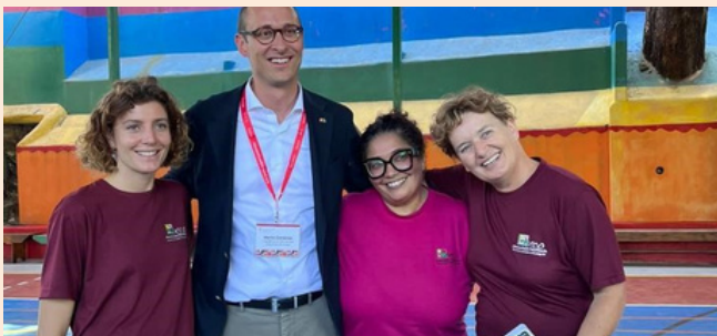
Presidente do Conselho Nacional com equipe da ONG ARCO

A delegação de parlamentares se mostrou impressionada pelo importante trabalho de promoção do desenvolvimento integral de famílias que vivem em condição de vulnerabilidade na região do Jardim Ângela. Para isso desenvolve ações de promoção humana, transformação, acolhimento social, educação, cultura, trabalho e qualidade de vida. O nome ARCO é um acróstico das palavras: AMOR, RESPEITO, COOPERAÇÃO e OPORTUNIDADE, itens essenciais para transformação social.