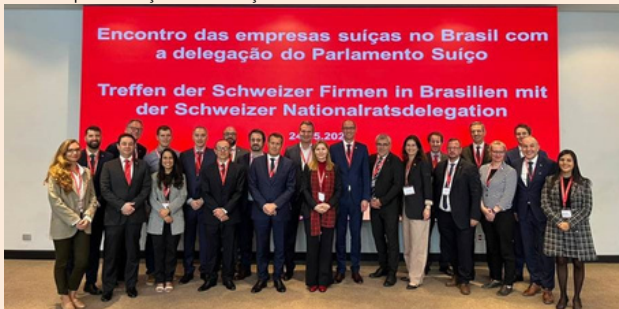
Almoço com representantes de empresas suíças

Foi unânime o desejo das empresas suíças na conclusão do Tratado de Livre Comércio entre o Mercosul e a EFTA, para aumentar tanto a competitividade quanto a presença de empresas da Suíça no mercado brasileiro. A Embaixada da Suíça, em cooperação com a Secretária de Comércio, continua trabalhando para a concretização deste acordo. Nas próximas semanas estão previstas várias reuniões para avançar na finalização deste acordo.