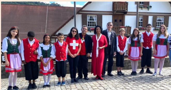
Celebração do Mês Suíço em Nova Friburgo

O evento organizado pelo Consulado Geral em São Paulo, em colaboração com a SWISSCAM Câmara de Comércio Suíço-Brasileira, com autoridades contou com mais de 200 convidados na residência consular. Outras celebrações da pelo Brasil ocorreram no Chalet Suisse em Curitiba, em Florianópolis nas proximidades da Lagoa da Conceição e também um concerto no aeroporto, na Sociedade Filantrópica Suíça em Porto Alegre, no Retiro Suíço em Campo Limpo Paulista e também no Clube Esportivo Helvetia, em São Paulo com a "Festa Suíça". As comunidades suíças em Belo Horizonte e Fortaleza também se reuniam para celebrar a data.