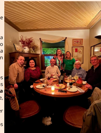
Happy Hour em São Paulo

A reserva do seu lugar pode ser feita diretamente no restaurante, pelo telefone (41) 99601-7694. Esperamos você para um bate-papo descontraído!