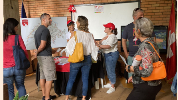
Em Brasília, os visitantes do stand da Suisse puderam participar de um quiz online sobre o país