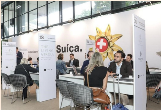
Stand Turismo da Suíça na IILTM Latin America 2023

O Turismo da Suíça promove há alguns anos a campanha 100% Women com roteiros de viagens e passeios exclusivos para mulheres. Este ano o destaque foi para experiências de bicicleta. Entre os dias 24 e 27 de abril o Turismo da Suíça reuniu mulheres influenciadoras de todo o mundo para explorar Saint-Ursanne, La Chaux-de-Fonds e Neuchâtel de bicicleta promovendo algumas razões pelas quais devemos explorar a Suíça sobre duas rodas, sendo: diversidade de paisagens espetaculares, afinidade viajando com pessoas como você, facilidade com trilhas marcadas e bem conservadas, hotéis adequados e fácil aluguel de bicicletas, SWISStainable sendo uma forma de vivenciar a Suíça de forma sustentável e autêntica e, segurança graças a uma baixa taxa de criminalidade, as mulheres que viajam sozinhas se sentem seguras.