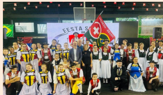
Celebração 1º de Agosto no Clube Esportivo Helvetia