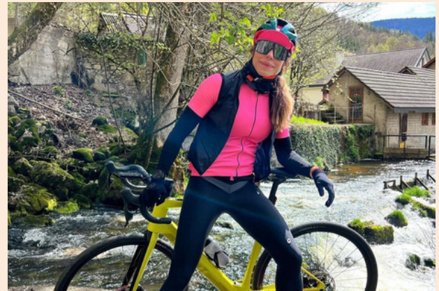
Influenciadora Daniella Cicarelli representou o Brasil