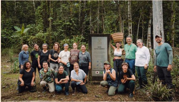
Grupo na 1ª fase do programa de pesquisa Fungi Cosmology na Amazônia