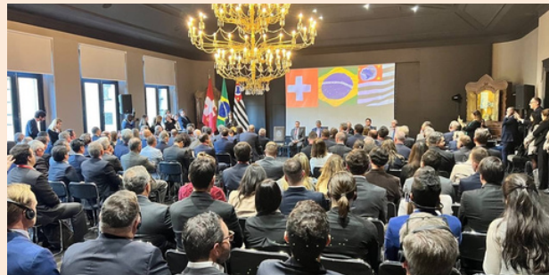
Evento no Palácio do Governo de São Paulo

Na ocasião da visita do Conselheiro Federal Guy Parmelin , o Swiss Business Hub organizou a agenda para uma grande delegação de empresas suíças do setor infraestrutura e tecnologias limpas . Realizamos encontros com as principais operadoras e concessionárias dos setores de saneamento, ferroviário e de energia nas cidades de São Paulo e Rio de Janeiro. No Palácio do Itamaraty em Brasília, a delegação foi recebida pelo Vice Presidente Geraldo Alckmin e pelo Ministro-Chefe da Casa Civil Rui Costa para uma atualização sobre os planos do Governo Federal e o pipeline de projetos no setor da infraestrutura. Já em São Paulo, a delegação foi recebida pelo Governador Tarcísio de Freitas e respectivas Secretarias Estaduais para apresentar o pipeline de projetos de infraestrutura e os planos para o compromisso com o net zero 2050 do Estado de São Paulo. As apresentações foram seguidas por três mesas-redondas setoriais de discussão. Com mais de 130 participantes, essa foi a maior delegação internacional recebida pelo Governo do Estado de São Paulo. As empresas suíças conseguiram estabelecer muitos contatos novos e a maioria está confiante em realizar novos negócios no Brasil.