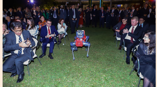
AnimalD, um robô fruto da parceria suíça-brasileira trouxe os resultados

O Prêmio Suíço de Sustentabilidade e Inovação é a primeira iniciativa desenvolvida pelo Grupo de Trabalho de Sustentabilidade (GTS) formado pela Embaixada Suíça no Brasil, a SWISSCAM , o Instituto Ekos Brasil , a Swissnex no Brasil e o Swiss Business Hub Brazil . O grupo tem como principal objetivo identificar sinergias e reunir ações e iniciativas público-privadas entre atores suíços e brasileiros.