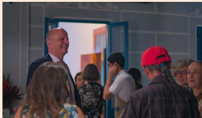
Cônsul-Geral da Suíça no Rio de Janeiro, Bernhard Furger, com convidados na Casa da Glória, Rio de Janeiro

A cidade de Nova Friburgo , na Região Serrana do Rio, celebram o “Agosto Suíço” com programações culturais ao longo do mês. Os suíços foram os primeiros a chegar nesta cidade, que completou 204 anos no último dia 16 de maio. No interior do Estado de São Paulo, com seus laços históricos que remontam há mais de 140 anos, a Colônia Helvetia atraiu um grande público com a Festa da Tradição , na presença do Embaixador Pietro Lazzeri.