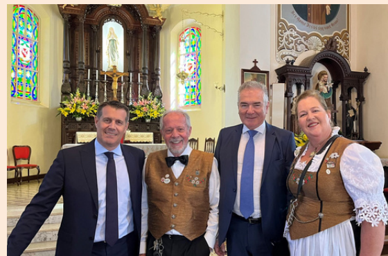
Festa da Tradição em Itaipava - São Paulo