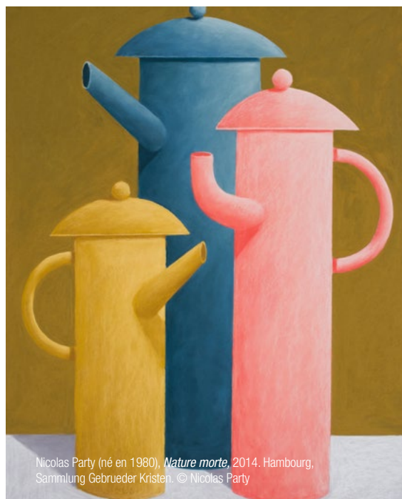
Nicolas Party (né en 1980), Nature morte, 2014. Hambourg, Sammlung Gebrüder Kristen.

En toute simplicité, Nicolas Party ne cache pas son appartenance à ses racines profondément ancrées dans son pays natal. Oui, il est heureux d'être Suisse et il l'exprime.