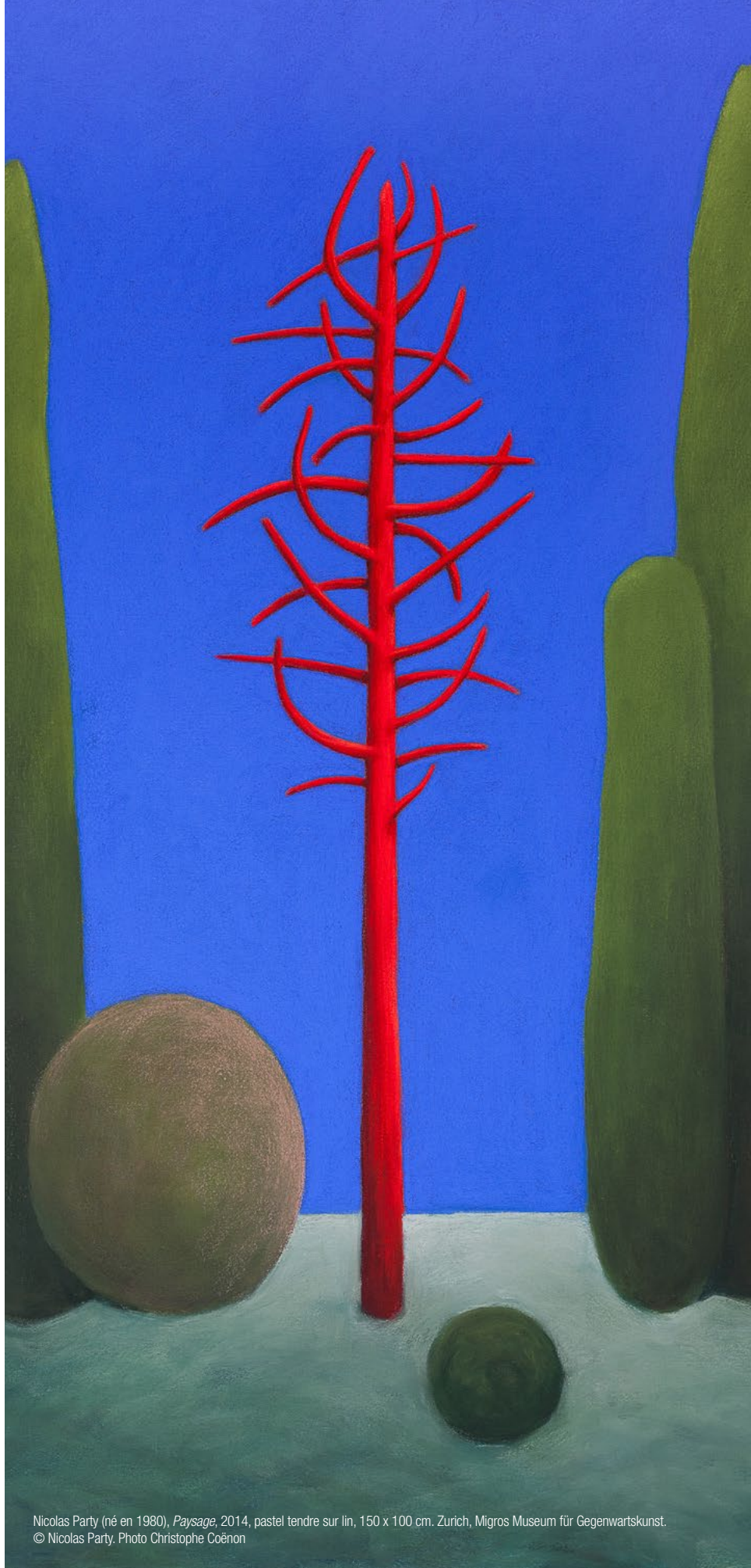
Nicolas Party (né en 1980), Paysage , 2014, pastel tendre sur lin, 150 x 100 cm. Zurich, Migros Museum für Gegenwartskunst. © Nicolas Party, Photo Christophe Coënon