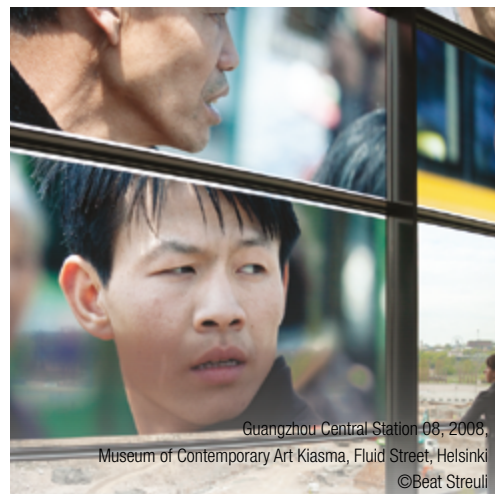
Guangzhou Central Station-08, 2008. Museum of Contemporary Art Kiasma, Fluid Street, Helsinki