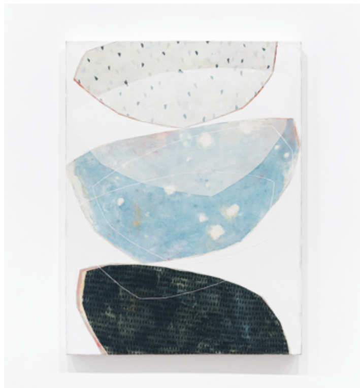
Éclaircie Acrylique sur toile, 40x30 pouces

D'aussi loin que je me souvienne, et sans nécessairement avoir le désir formulé de devenir artiste, j'ai toujours eu une affinité spéciale pour la peinture et le dessin. J'ai d'abord complété des études en graphisme, métier que j'ai pratiqué pendant une vingtaine d'années. Parallèlement à ma vocation professionnelle, je continuais de m'adonner à ma passion pour les arts visuels. Autodidacte, j'ai beaucoup appris par moi-même. Essais et erreurs. J'ai également suivi quelques cours de peinture en ateliers privés. Un jour, alors que je tenais une exposition dans un local loué, mon travail est tombé dans l'œil d'un galeriste. C'est suite à cela que j'ai su qu'il était envisageable pour moi de délaisser tranquillement le graphisme dans le but de me consacrer à temps plein à la peinture. Bien entendu, ce que je vous décris ici en quelques lignes simplifiées relève en réalité d'une évolution s'étalant sur plusieurs années; une progression lente et parsemée de sinuosités!