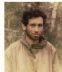
Douna Loup Boris, 1985

Boris Weisfeiler, quarante-quatre ans, disparaît dans le Chili de Pinochet. Né en URSS au sein d'une famille juive, ce surdoué des chiffres s'exile aux États-Unis pour pouvoir exercer librement les mathématiques. Silhouette longiligne, large sourire, il s'évade souvent pour marcher seul dans les contrées les plus sauvages possibles: portrait en creux d'un matheux au charme irrésistible. 2019-2020. Douna Loup, petite-nièce de Boris, veut comprendre cette disparition non élucidée. De Boston à Moscou en passant par le Chili, elle mène l'enquête, rencontre des témoins, rassemble des pièces à conviction. Elle et lui se retrouvent, via les archives, dans leur rapport fusionnel avec la nature. En nous transportant dans le Chili des années 1980, Douna Loup nous entraîne aussi au plus intime d'elle-même.