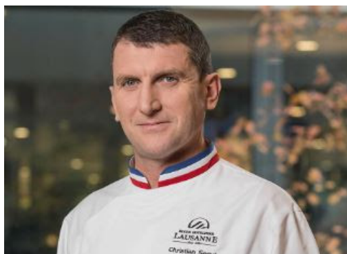
Christian Segui ©École hôtelière de Lausanne