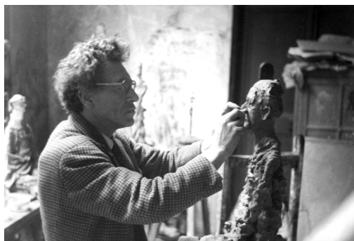
A. Giacometti, par sa femme Annette

Plus connu comme le sculpteur aux figures filiformes, Giacometti fut également un grand peintre et un grand dessinateur. Au cœur de sa démarche, le dessin. Très tôt, il a déclaré : « Ce qu'il faut dire, ce que je crois, c'est que, qu'il s'agisse de sculpture ou de peinture, il n'y a que le dessin qui compte [...], pour moi en tout cas, tout n'est que dessin. »