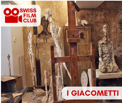
Alberto Giacometti, Atelier, Institute Fondation Giacometti, Paris

Profitez de voir les meilleures productions contemporaines suisses: i Giacometti , un documentaire de Susanna Fanzun , vous est proposé, par le Swiss Film Club des Représentations suisses au Canada, en vo romanche/allemand/français avec des sous-titres au choix en français ou en anglais.