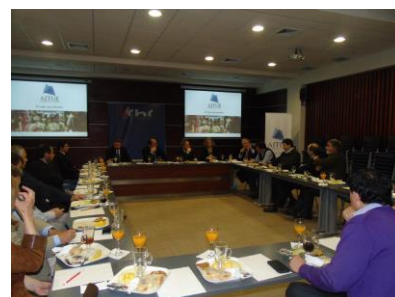
Conferencia con el Embajador, el experto Thomas Baumer y autoridades regionales.