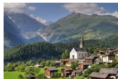
Comuna de Ernen en la región de Goms