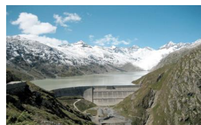
Represa en la región del Grimsel

El último día, la delegación recibió amplia información sobre el concepto de gestión energética y de certificación llamado “Ciudad Energética” y visitó la capital Berna, ciudad que tiene esta certificación. Además, los delegados se reunieron con autoridades de la Oficina Federal para el Ordenamiento Territorial y con la Consejera Federal del Departamento de Medio Ambiente, Transportes, Energía y Comunicación, señora Doris Leuthard. Se acordó en esta reunión que Suiza y Chile elaborarán a mediano plazo un memorándum de entendimiento en el ámbito de energía.