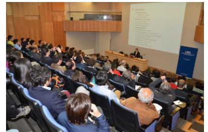
La sala llena durante la presentación del Embajador.