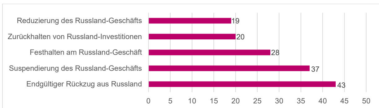
Abbildung 2: Aussagen ausgewählter deutscher Unternehmen zu ihrer Reaktion auf den Ukraine-Krieg. 40

Seit Kriegsbeginn in der Ukraine im Februar 2022 haben deutsche Unternehmen mehr als 10 Milliarden Euro im Zusammenhang mit ihren Geschäften in Russland abgeschrieben. Der angeschlagene Gasimporteure Uniper wurde im September 2022 verstaatlicht. Der Bund einigte sich mit dem finnischen Mutterkonzern Fortum auf ein Stabilisierungspaket und hält künftig 99% der Unternehmensanteile. Uniper kontrolliert 40% des deutschen Gasmarkts und ist somit systemrelevant für die deutsche Wirtschaft. Ebenfalls verstaatlicht wurde im November 2022 der Gasimporteure Securing Energy for Europe (ehem. Gazprom Germania), der zuvor bereits unter Treuhänderschaft der Bundesnetzagentur gestanden hatte.