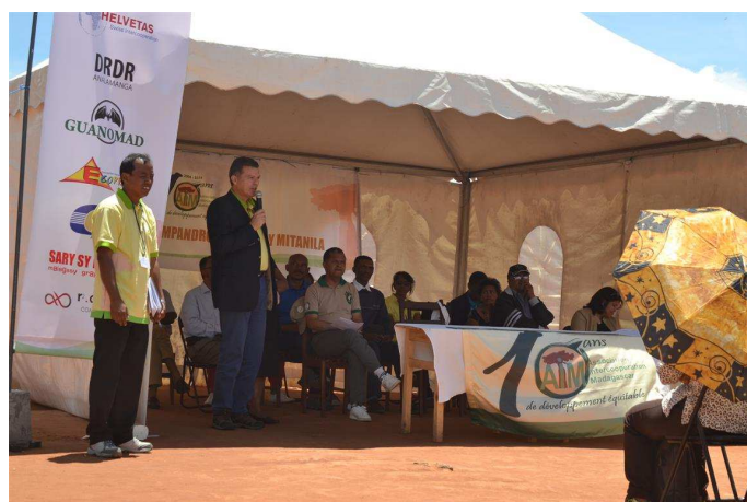
Célébration de 10 ans d'existence sous le thème de l'agriculture familiale