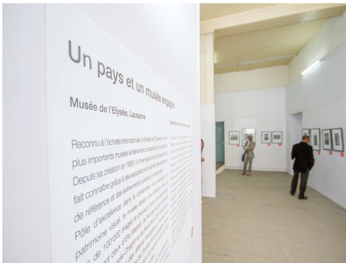
Salle d'exposition Tahala Rarihasina

Le Comité international de la Croix-Rouge (CICR) fêtera l'année dernière son 150 e anniversaire et cette année célébrera le 150 e de la première Convention de Genève. L'exposition «Avec les victimes de guerre. Photographies de Jean Mohr» est une des manifestations organisée à cette occasion.