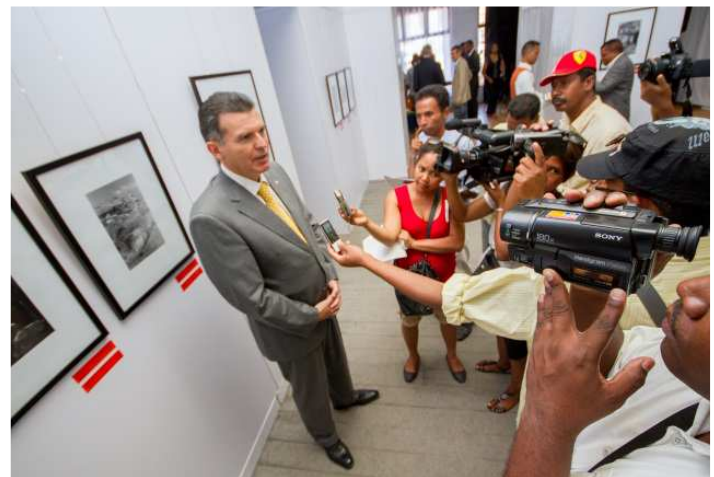
L'Ambassadeur de Suisse sous le feu des médias

Le débat a porté sur le thème « des défis du droit international humanitaire à Madagascar » avec la participation des étudiants de la faculté de droit de l'Université catholique de Madagascar.