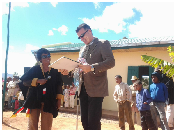
L'Ambassadeur inaugurant une école rurale financée par les petites actions de l'Ambassade

Vous trouverez comme d'habitude des informations utiles sur les activités consulaires de l'Ambassade et notamment quelques nouveautés en matière de visas Schengen, la Suisse représentant désormais la Pologne en la matière à Antananarivo.