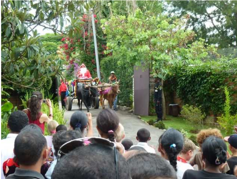
Arrivée du Saint Nicolas aux portes de la Résidence

La tradition a, une nouvelle fois été respectée et la communauté suisse de Madagascar a célébré le 7 décembre dernier la fête de la St Nicolas à la Résidence de Suisse à Ambohibao.