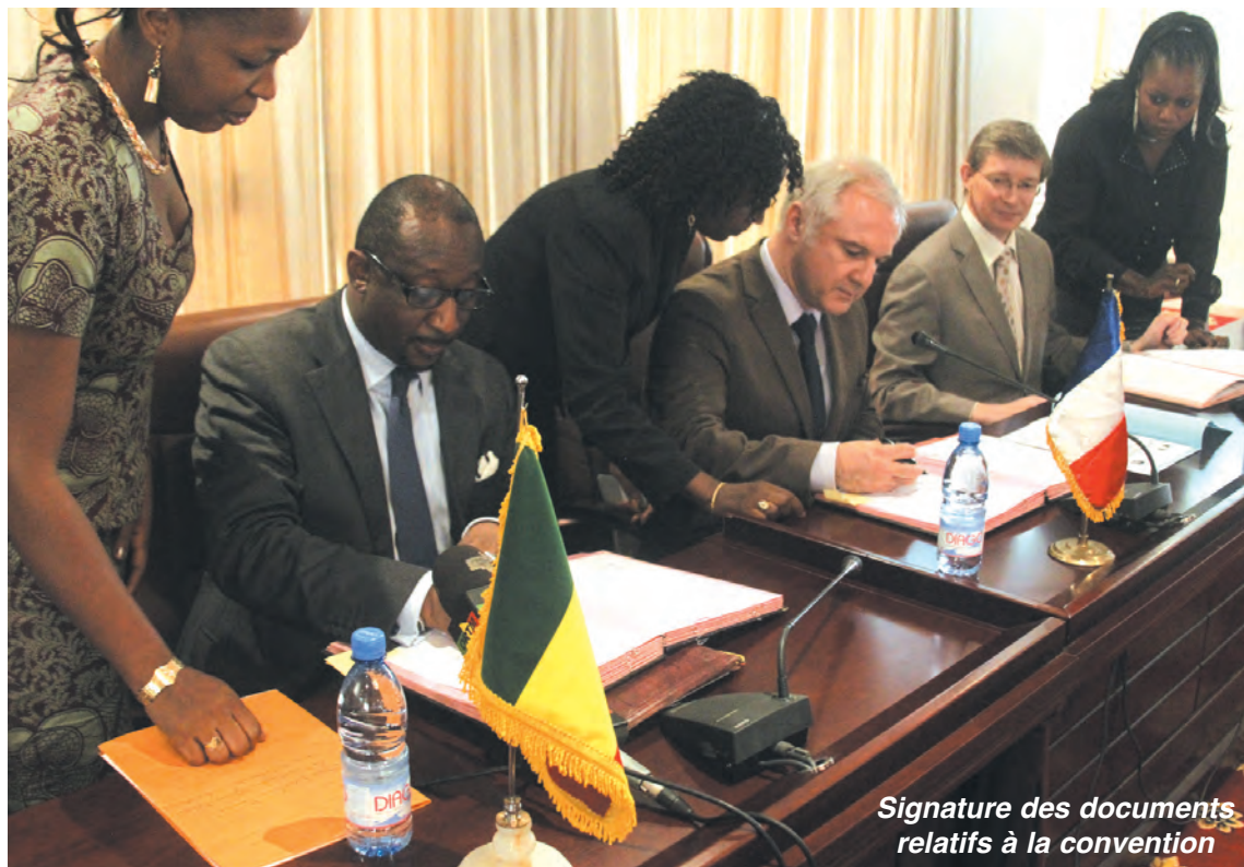
Signature des documents relatifs à la convention

En plus de son engagement militaire aux côtés de notre pays pour bouter les terroristes et autres bandits armés hors de nos frontières, la France participe activement à la relance économique de notre pays. Elle a confirmé cette adhésion à la politique de relance économique mise en place par le gouvernement de transition, à travers la signature hier d'une convention d'aide budgétaire entre notre pays et l'Agence française de développement (AFD).