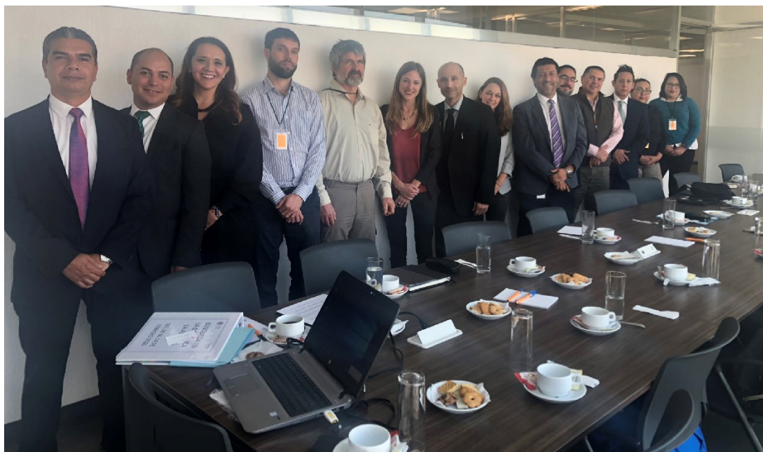
Representantes de la Fiscalía General de la República, de la Secretaría de Relaciones Exteriores, la Embajada y los expertos forenses de la Universidad de Lausana en misión en el estado de Veracruz en febrero del 2020.

Desde hace algunos años, la SRE y el Departamento Federal de Asuntos Exteriores de Suiza sostienen un diálogo anual en materia de Derechos Humanos. Durante el diálogo del año pasado, que se llevó a cabo en Berna, se decidió implementar un proyecto bilateral en materia forense. El objetivo de este proyecto es el apoyar al gobierno mexicano en la búsqueda de personas desaparecidas e identificación de cuerpos. En febrero de este año llegaron dos expertos forenses de la Universidad de Lausana para encontrarse con las autoridades mexicanas y acompañarlas a una búsqueda en el estado de Veracruz.