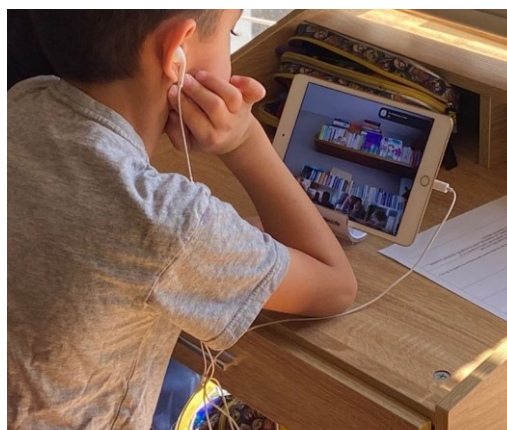
Clases desde casa. Campus CDMX