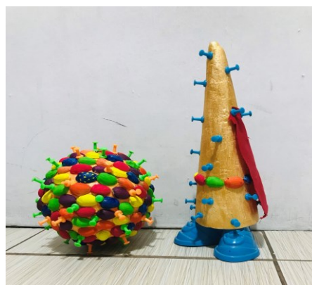
El Coronavirus y el antídoto. Ana Sofía Cervantes Campus Cuernavaca

Concierto desde casa: https://www.youtube.com/watch?v=Te1VRk14SCE&t=7s