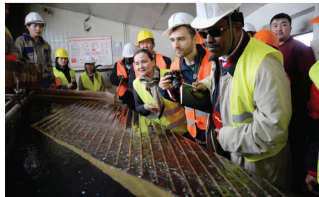
Бичил уурхайн салбарт үйл ажиллагаа явуулж буй олон улсын байгууллагын төлөөллүүд мөнгөн усгүй технологиор хүдэр боловсруулах цехтэй танилцав.