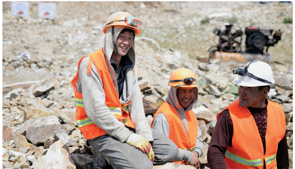
Бичил уурхайг албажуулснаар бичил уурхайчдын амьжиргаанд эерэг өөрчлөлт гарав.

Бичил уурхайн салбар нь орон нутгийн иргэд амьжиргаагаа залгуулахад чухал ач холбогдолтой бөгөөд энэ салбарт хэрэгжиж буй Тогтвортой бичил уурхай төслийн (ТБУТ) үр шимийг бичил уурхай эрхэлж буй 60 гаруй мянган иргэд болон тэдний гэр бүлийнхэн хүртэж байна. ТБУТ нь (I) бичил уурхайд хүний эрхэд суурилсан хандлагыг төлөвшүүлэх, (II) алтны нийлүүлэлтийн сүлжээг албажуулахад дэмжлэг үзүүлэх, (III) бичил уурхайн олон улсын мэдлэгийн төв байгуулахад анхаарч байна.