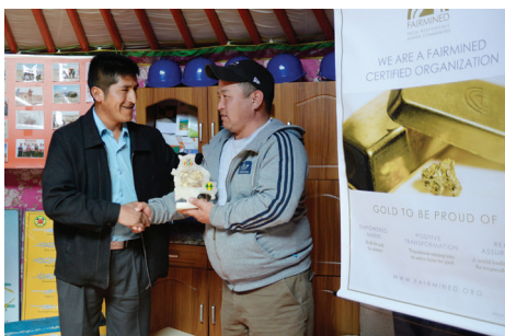
Монголын бичил уурхайчдын байгууллагын үйл ажиллагаа олон улсын алт олборлох стандартад нийцэв.