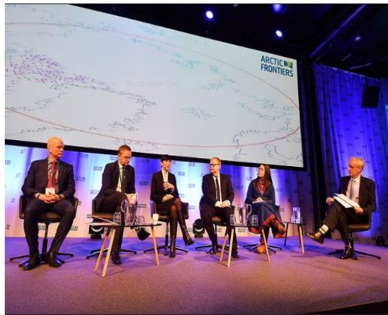
La Ministre Sørreide lors d'un débat

Die Arctic Frontiers, eine der wichtigsten internationalen Arktisforen, veranstaltete vom 21. bis 26. Januar 2018 in Tromsø ihre zwölfte Auflage. Mehr als 3'000 Personen nahmen daran teil. Sie vertraten akademische, wissenschaftliche, wirtschaftliche und Regierungskreise.