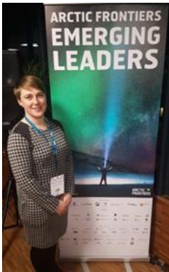
Emerging Leaders, 2018

Diesen Januar erhielt ich die einmalige und grossartige Gelegenheit, als Vertreterin der Schweiz, am Emerging Leaders Program von Arctic Frontiers teilzunehmen. Dieser inspirierende und zugleich anspruchsvolle Workshop bietet einer kleinen Gruppe von 30 jungen Menschen verschiedenster Herkunft die Möglichkeit über die Arktis und ihre Zukunft zu diskutieren. Während des fünftägigen Workshops beleuchteten wir viele Themen, wie Menschen, Umwelt, Technologie, Wirtschaft und Sicherheit, die wichtig sind für eine nachhaltige Zukunft der Arktis. Gemeinsam erarbeiteten wir unserer Vision einer nachhaltigen Arktis die wir anschliessend im Rahmen der Arctic Frontiers Konferenz vor Politikern, Entscheidungsträgern, Diplomaten und Vertretern der Industrie vorstellten. Insgesamt weckte dieser Workshop in mir die Hoffnung, dass wir in der