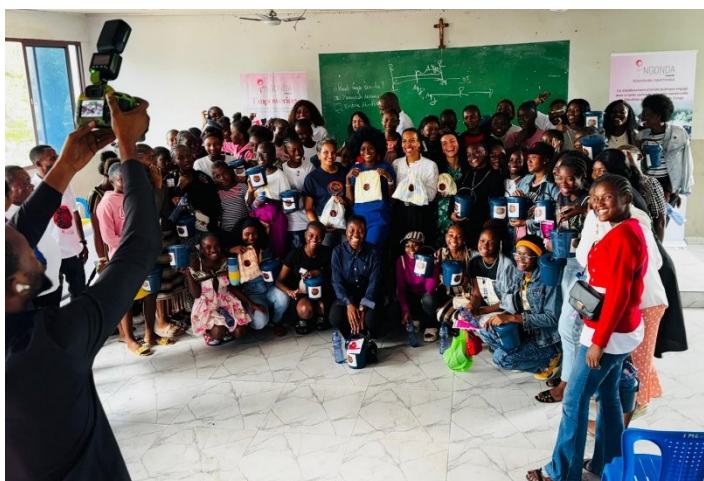
Visite d'une école du Groupe scolaire de Lemba, le 26 juin 2025

L'ambassade de Suisse est fière d'apporter son soutien aux femmes en RDC pour contribuer à améliorer leurs conditions et qu'elles puissent vivre leur cycle avec davantage de moyens, de dignité et de respect.