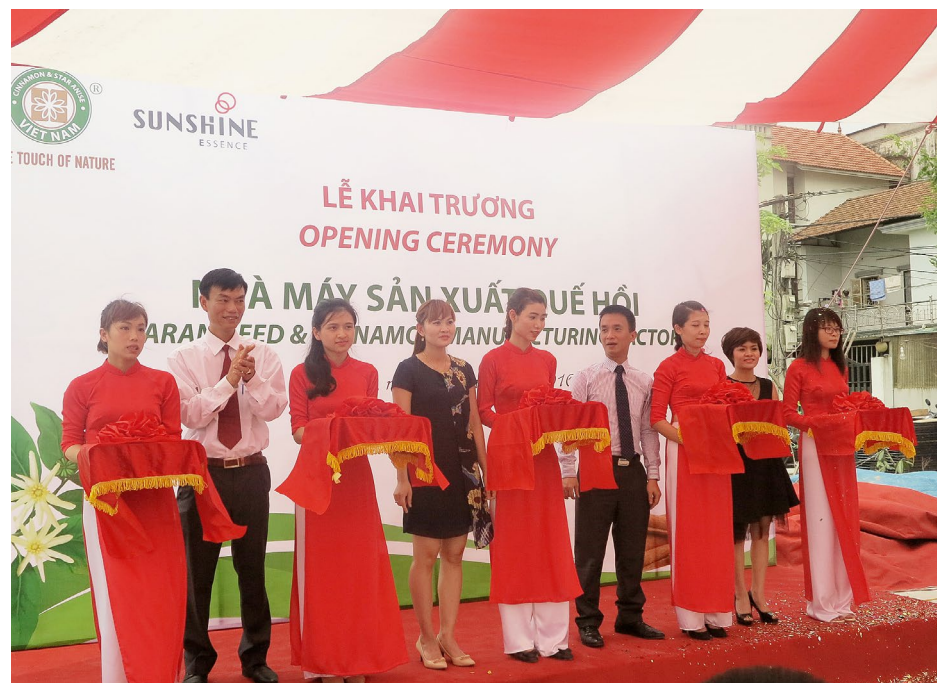
Eröffnung der ersten Gewürzfabrik in Nordvietnam – ein wichtiger Schritt zur Entwicklung des Gewürzsektors.

Auf allen Ebenen mussten schlanke Verwaltungsstrukturen geschaffen werden, um Zeit und Geld zu sparen, die Entscheidungsprozesse zu dezentralisieren und mehr Mittel für Entwicklungsaktivitäten als für die Verwaltung einsetzen zu können. Verwaltungsaufgaben wurden zum Teil an Partner in den Wertschöpfungsketten delegiert. Die DEZA blieb verantwortlich für die Programmüberwachung und -evaluation und verfolgte die erzielten Fortschritte.