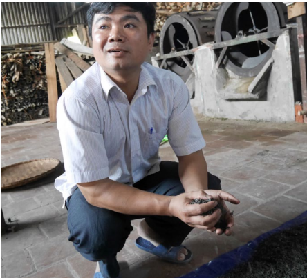
Der Leiter der Teefabrik von Bac Ha vor einer vom Programm finanzierten Teetrocknungsanlage.