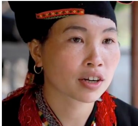
Vom Programm unterstützte Zimtbäuerin in Nordvietnam.

Vor dem MARP-Programm verdiente fast die Hälfte der Haushalte weniger als 50