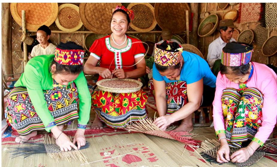
Frauen einer ethnischen Minderheit beim Bambusflechten.

Das Programm unterstützte vier Projekte mit acht Produktwertschöpfungsketten in acht verschiedenen Provinzen Nordvietnams. Die Partnerorganisation SNV Vietnam engagierte sich im Gewürzsektor (Sternanis, Kardamom, Zimt). Oxfam unterstützte die Rattan- und Bambuswertschöpfungskette. Der vietnamesische Verband der Kunsthandwerksexporteure (VIETCRAFT) setzte sich für eine nachhaltigere Wertschöpfungskette für traditionelle Textilien (Hanf, Seide) ein. HELVETAS Swiss Intercooperation stärkte die Wertschöpfungsketten für hochwertigen Tee (Shan-Tee) in Nordvietnam, Laos und Myanmar.