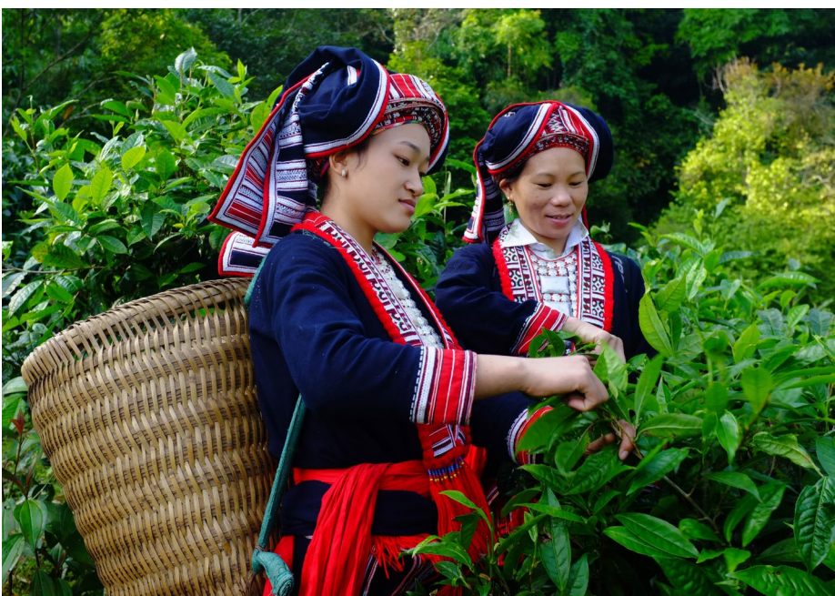
Dao-Frauen in Ha Giang pflücken Shan-Tee.

Die wichtigste Lehre war wohl das MARP-Modell selbst. Viele Aspekte des Programms funktionierten gut, und dank ihrer Kombination konnten die angestrebten Ergebnisse erzielt werden. Das MARP-Modell könnte weiter verbessert werden, indem mehr Gewicht auf die betriebswirtschaftliche Unterstützung der Unternehmen in der Wertschöpfungskette gelegt wird und indem inländische und internationale Käufer als Umsetzungspartner eingebunden werden, so dass sich die Wertschöpfungskette nachhaltiger entwickeln kann. Mit einem verfeinerten MARP-Modell könnten noch mehr Haushalte armer ethnischer Minderheiten in Vietnam ihr Einkommen erhöhen und ihre Lebensqualität verbessern.