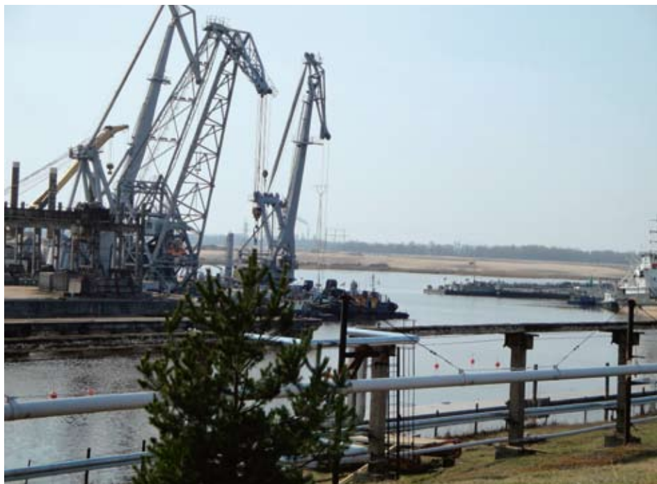
In Lettland plant die Schweiz mit 13 Mio. Franken die Sanierung des ölverseuchten Sarkandaugava-Gebiets im Industriehafen von Riga zu unterstützen (im Bild). Dadurch soll auch die Verschmutzung des in die Ostsee mündenden Flusses Daugava gestoppt werden.