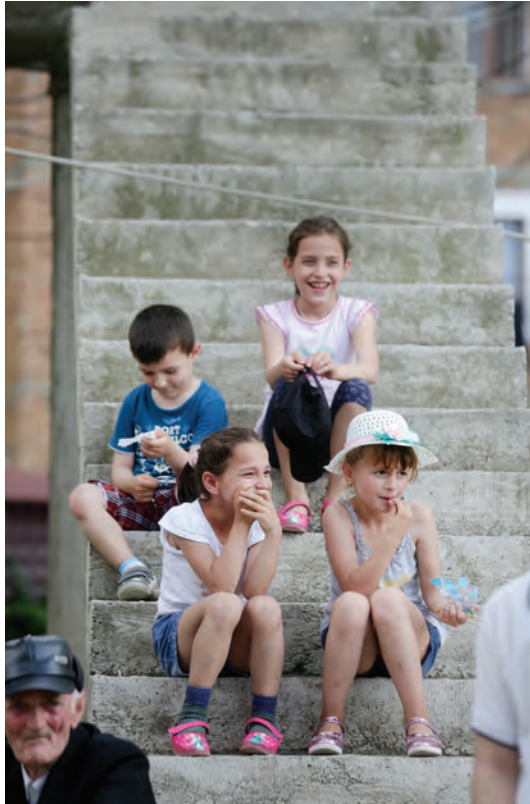
Fëmijë pranë sheshit kryesor në Has në veri të Shqipërisë

Është arritur një konsensus i përbashkët për nevojën e zbatimit të reformave me ndjeshmëri të lartë në drejtësi dhe të luftës kundër korrupsionit dhe krimit të organizuar që janë gjerësisht të përhapur. Megjithatë, rezistenca e atyre që përfitojnë nga