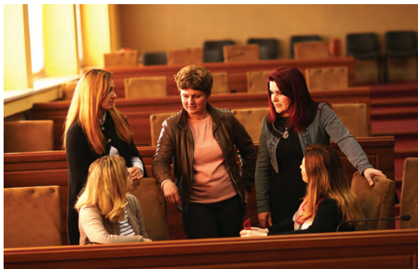
Gra politike nga Shqipëria e veriut të mbështetura nga programi për decentralizimin.

Zvicra ka promovuar aksionet civile në Shqipëri, veçanërisht në lidhje me funksionimin e qeverisë vendore. Palët e interesit të shoqërisë civile dhe media të mbështetura nga Zvicra mobilizuan me sukses