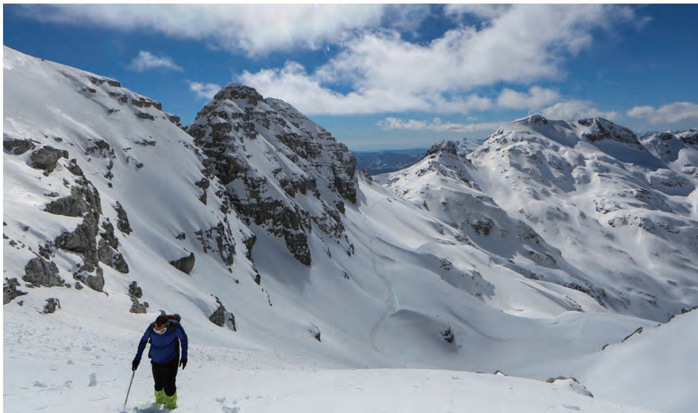
Numri i turistëve që vizitojnë zonat malore të Shqipërisë është në rritje.

duke nxitur njëkohësisht stabilitetin makroekonomik, duke lehtësuar krijimin e vendeve të punës dhe të të ardhurave, si dhe duke zhvilluar aftësitë e orientuara nga tregu. Programi zviceran do të ndihmojë për të forcuar qeverisjen ekonomike duke mbështetur institucione financiare publike kombëtare kryesore për përmirësimin e MFP-së, dhe rregullimit e mbikëqyrjes së sektorit financiar. Ajo do të trajtojë sfidat kyçe të sektorit privat, veçanërisht ato në bujqësi, TIK dhe turizëm, dhe duke konsideruar shkallën e lartë të papunësisë tek të rinjtë, ajo do të rrisë mbështetjen në arsimin dhe formimin profesional (AFP), të orientuar nga tregu i punës.