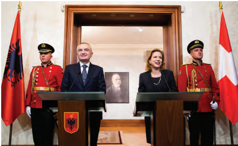
Shkëmbimet e nivelit të lartë midis Zvicrës dhe Shqipërisë janë intensifikuar.

Bashkëpunimi me Europën Lindore është një komponent integral i politikës së jashtme dhe ekonomike të Zvicrës. Zvicra mbështet vendet ish-komuniste në Europën Lindore, si qeveritë, ashtu edhe shoqëritë e tyre civile, në rrugëtimin drejt demokracisë dhe ekonomisë sociale të tregut. Asistenca e Zvicrës për tranzicionin në rajon bazohet në interesin reciprok për zhvillim social dhe ekonomik përfshirës, stabilitet, siguri dhe integrim europian. Ajo motivohet nga solidariteti i Zvicrës me të varfrit dhe të përjashtuarit dhe nga respekti për të drejtat e njeriut. Me gjithë progresin e shënuar, mbeten akoma shumë reforma për t'u ndërmarrë në fusha si decentralizimi, sundimi i ligjit, zhvillimi ekonomik dhe shërbimet publike. Për më tepër, asistenca për tranzicionin krijon mundësi ekonomike për Zvicrën.