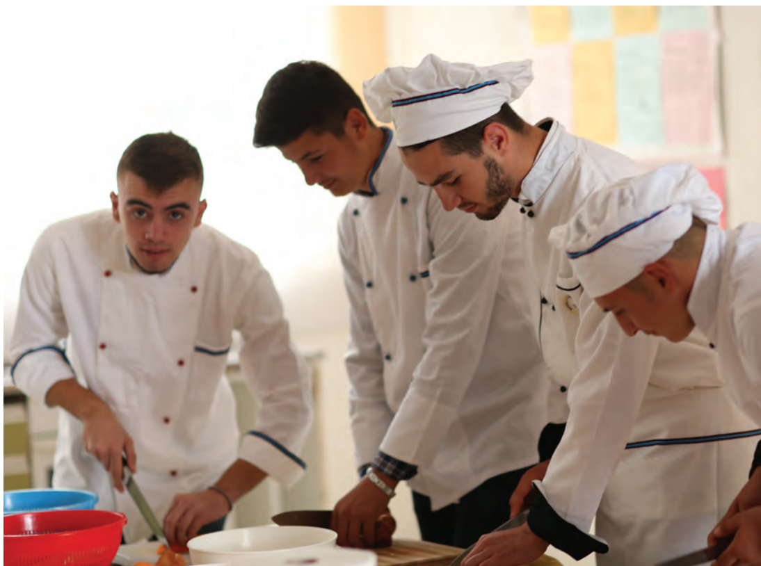
Studentë të shkollës profesionale për hoteleri dhe turizëm në Vlorë.

Gjatë periudhës 2014-2017, Zvicra mbështeti stabilitetin makroekonomik, zhvillimin e sektorit privat dhe punësimin e të rinjve. Në nivelin makroekonomik, me mbështetjen e Zvicrës, Ministria e Financave krijoi një model parashikimi makroekonomik për politikëbërjen e bazuar në fakte. Banka e Shqipërisë përmirësoi kapacitetet e veta për hartimin e politikave monetare, që ka kontribuar për një kthim gradual të inflacionit drejt vlerës së synuar. Sisteme të reja kompjuterike ndihmojnë qeverinë e Shqipërisë të menaxhojë dhe të raportojë më mirë mbi borxhin publik.