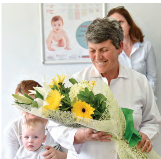
Infermiere në qendrën shëndetësore të rinovuar, Cakran.

Zvicra ka mbështetur sektorin e shëndetësisë në Shqipëri që prej viteve '90 dhe që prej vitit 2013 është përqendruar në kujdesin shëndetësor parësor. Kontributi ka sjellë një sërë nismash dhe inovacionesh për përmirësimin e sistemit shëndetësor në nivel vendor dhe kombëtar. Ekspertiza zvicerane ka mbështetur dhe ndikuar në mënyrë të konsiderueshme politikën dhe planin kombëtar të