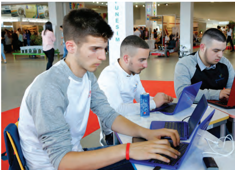
Studentë IT në shkollën profesionale 'Pavarësia', Vlorë.

Synimi i përgjithshëm i Strategjisë së Bashkëpunimit Zviceran 2018-2021 është të kontribuojë për një demokraci funksionale, shërbime publike të përmirësuara dhe një ekonomi tregu konkurruese dhe përfshirëse në mbështetje të integritimit evropian të Shqipërisë.