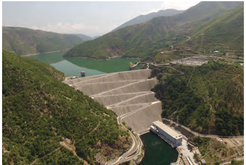
Diga e hidrocentralit të Fierzës mbi lumin Drin.

Reformat e kohëve të fundit në sektorin e energjisë kanë pasur sukses të madh. Shqipëria u rendit e 25-ta nga 127 vende në Raportin e Indeksit të Performancës së Arkitekturës Botërore të Energjisë 2017, duke e renditur më lart se të gjitha vendet e Europës Juglindore. Progresi në zhvillimin e sektorit të gazit dhe veçanërisht ndërtimi i Gazsjellësit Trans