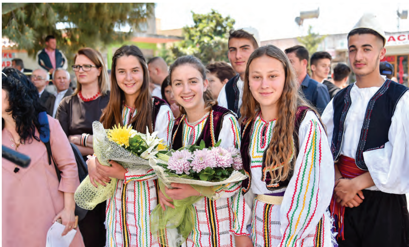
Të rinj pjesëmarrës në një aktivitet në Cakran, Fier.