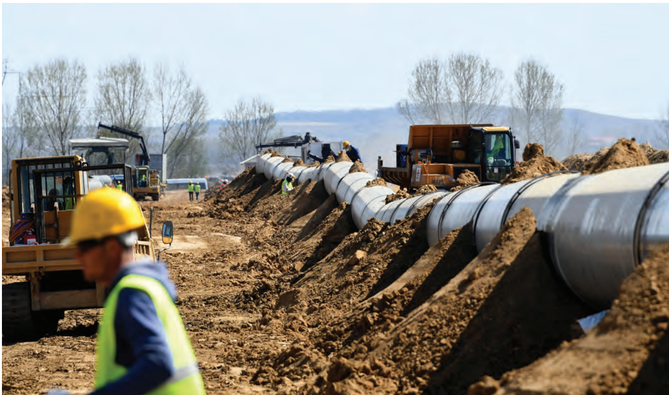
Puna në vazhdim për instalimin e Gazsjellësit Trans Adriatik 100 km në jug të Tiranës.

Mësimet e nxjerra: Gjatë dy dekadave të fundit, Zvicra ka dhënë kontribut të qenësishëm për zhvillimin e sistemit të furnizimit me energji në Shqipëri, përfshirë këtu edhe sigurinë e digave. Për të vijuar përfitimin nga përvoja dhe reputacioni i mirë në këtë sektor, angazhimi zviceran do të përqendrohet te kërkesa për energji, duke përmirësuar efikasitetin e energjisë.