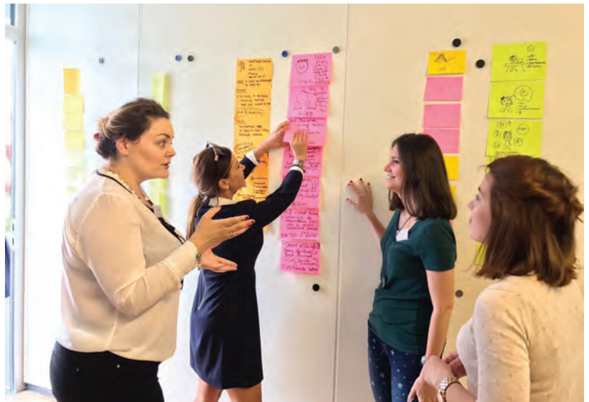
Diskutime dhe punë në grup gjatë një seminari.

Burimet: Angazhimet totale të planifikuara për 2018-2021 janë 105 milionë CHF. Qeverisja demokratike është fusha më e madhe në terma monetare (38 milionë CHF); shëndetësia është më e vogla (12 milionë CHF). Krahasuar me Strategjinë e bashkëpunimit zviceran 2014-2017, do të rriten financimi për qeverisjen demokratike (+46%), për zhvillimin ekonomik dhe punësimin (+41%), për shëndetësinë (+20%), ndërkohë që do të ketë një ulje të lehtë të fondeve për infrastrukturën urbane dhe energjinë (-8%). Rritja e financimit të SDC-së për AFP-në është në përputhje me Njoftimin Federal mbi Bashkëpunimin Ndërkombëtar. Shtojca 4 jep informacion të detajuar për periudhën 2018-2021 krahasuar me periudhën 2014-2017. 9