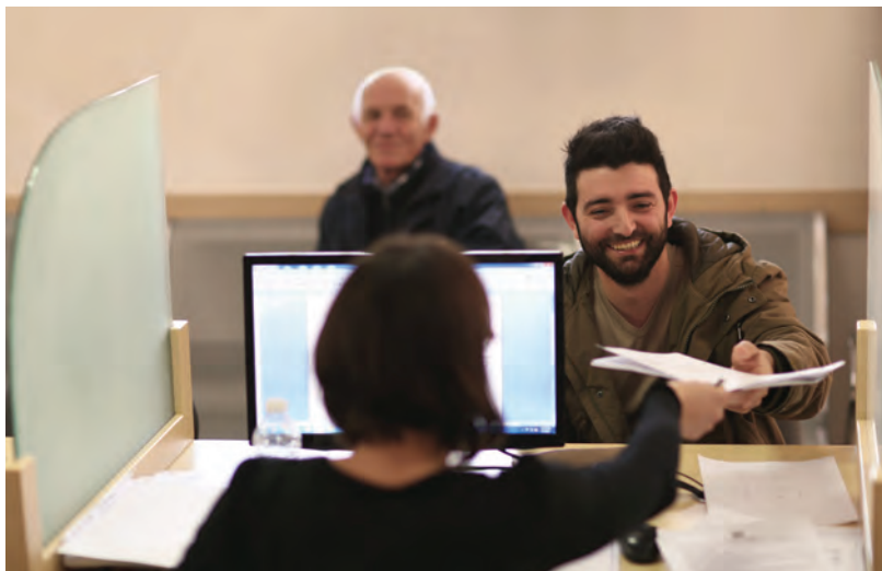
Qytetarë duke marrë shërbime në qendrën e re me 'një ndalesë'.

Duke konsideruar që Shqipëria ka përmirësuar kapacitetin e saj për të mbledhur kapital në tregjet ndërkombëtare, shumë angazhime të qeverisë nuk kërkojnë më financim me grante. Kjo është arsyeja përse programi zviceran i bashkëpunimit do të përqendrohet në sektorët që nuk mund të financohen me hua, ose aty ku grantet zvicerane mund të sigurojnë hua. Gjithashtu do të përqendrohet në ndërhyrje sistematike, për shembull reformat që synojnë të përmirësojnë kuadrin rregullator, të cilat nuk kanë një kthim të drejtpërdrejtë të investimit.