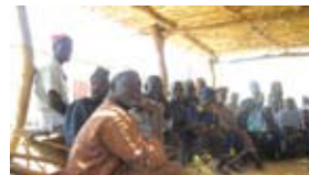
Riziculteurs de Yacrisoun