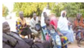
Riziculteurs de Ourekila