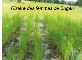
Rizières des femmes de Brigan