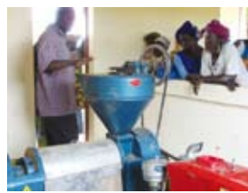
Unité de transformation, Kolondieba