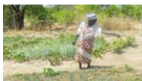
Dame « Courage », Niakobougou