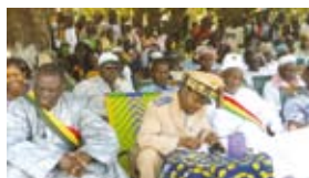
Autorités administratives, Bougouni