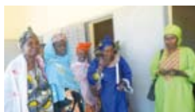
Femmes de Kolondieba