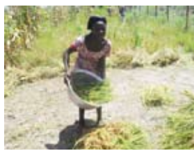
Rizicultrice de Ourekila

Les collectivités territoriales, les services techniques déconcentrés, les représentants de l'Etat, les associations d'usagers, la société civile, les autorités traditionnelles prennent des mesures de discrimination positive en faveur de la représentation des femmes au sein des différentes instances de prise de décision. Les femmes améliorent leurs capacités professionnelles et d'interpellation permettant une meilleure participation et un meilleur accès aux moyens de production.