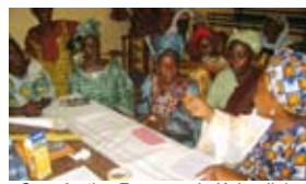
Coopérative Femmes de Kolondieba