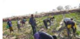
Périmètre maraîcher, Niakobougou