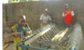
Confection de grillage, Bougouni