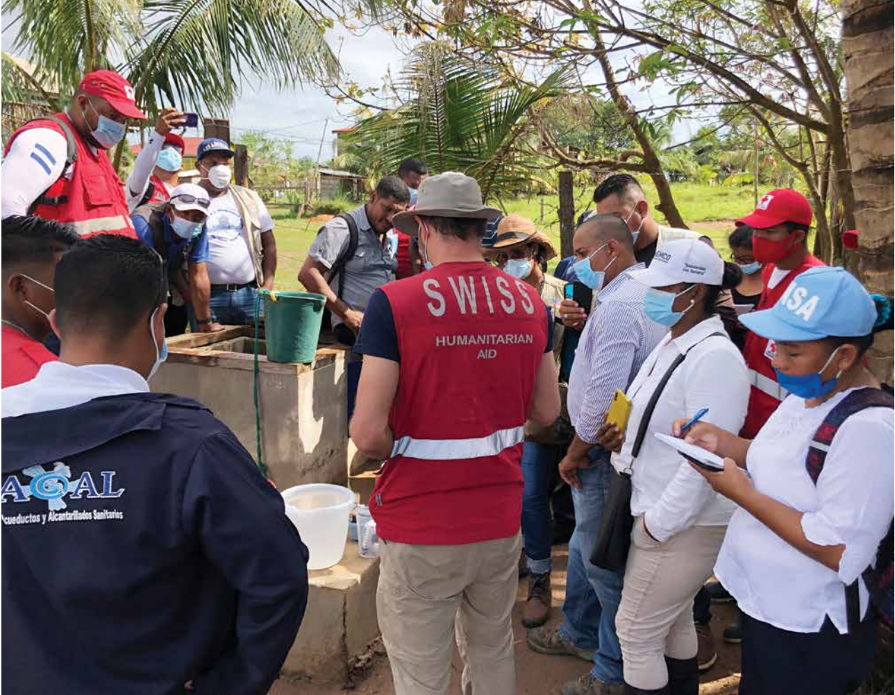
La ayuda humanitaria suiza se rige bajo los principios de humanidad, neutralidad, imparcialidad e independencia. En la imagen, expertos en agua apoyando luego del paso de los huracanes Eta e Iota en Bilwi, Región Autónoma Costa Caribe Norte, Nicaragua.

En Nicaragua , se pondrá énfasis en contribuir a fortalecer el enfoque multiactores, promoviendo espacios para la participación del sector privado y la sociedad civil en el desarrollo y la reducción de la pobreza. Suiza apoyará en particular centros de pensamiento que generan análisis y propuestas de reformas a largo plazo. Finalmente, Suiza liderará un diálogo político humanitario y fortalecerá la coordinación y la actuación del ecosistema de organizaciones humanitarias.