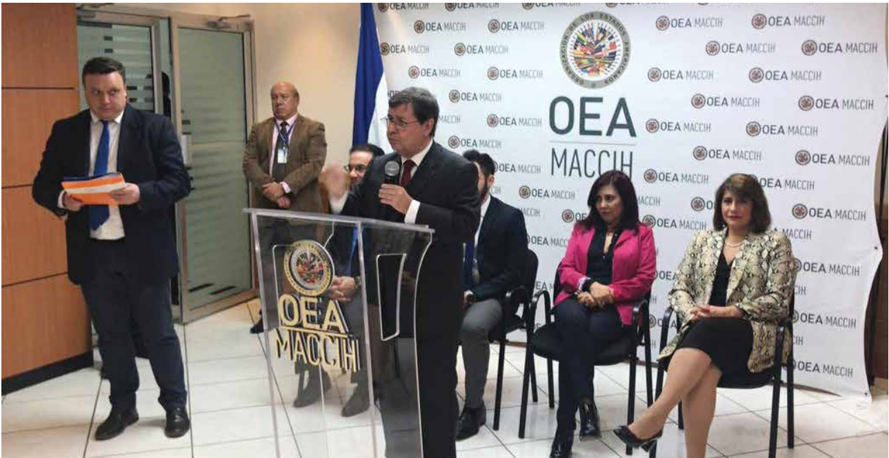
La Misión de Apoyo contra la Corrupción y la Impunidad en Honduras fue un mecanismo creado por acuerdo entre la OEA y el gobierno del país, funcionó de 2016 a 2020.

bilidad climática , Centroamérica está siendo afectada con mayor frecuencia por eventos climáticos extremos, períodos recurrentes de sequía combinados con exceso de lluvias e inundaciones severas. Millones de personas en el Corredor Seco de Centroamérica están sufriendo las consecuencias de años de sequía y eventos climáticos extremos agudizados por la pobreza extrema. El hambre en la región centroamericana se cuadruplicó en los últimos dos años y alcanzó los ocho millones de personas desnutridas, de las cuales 1,7 millones 2 requieren asistencia alimentaria urgente. De manera general, el número de personas con necesidades humanitarias se ha duplicado en 2020, alcanzando unos 10 millones 3 de personas en la región. Los conflictos por la propiedad y el uso y acceso a los recursos naturales se han agravado, siendo los más afectados los pueblos indígenas quienes habitan las áreas de reservas y de protección de los recursos hídricos. La región cuenta con un marco legal que favorece la protección y conservación ambiental, pero se requiere mayor voluntad política y capacidad de respuesta de las instituciones para cumplir a cabalidad con la implementación de las normas y políticas, el acceso a la información, a la participación y a la justicia en materia de derechos.