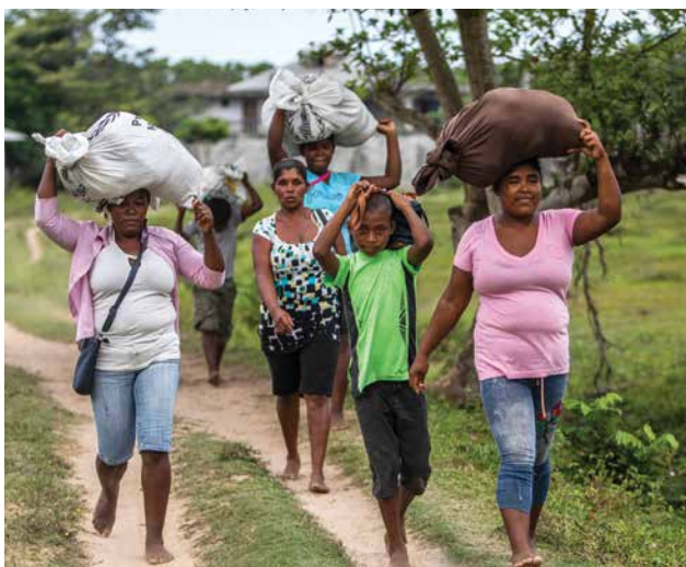
En Honduras la ayuda humanitaria se enfocó en la entrega de alimento a las comunidades afectadas por el paso de los huracanes Eta e Iota.

Los buenos resultados logrados por la Cooperación Suiza en el periodo 2018-2021 contrastan con el deterioro general del Estado de derecho y la democracia, la conflictividad exacerbada y los retrocesos en materia de lucha contra la pobreza en la región. Por lo tanto, el balance de la estrategia 2018-2021 es mixto. A pesar del contexto desafiante de estos cuatro años, gracias a la Cooperación Suiza, cerca de 125,000 personas están más preparadas frente a las frecuentes sequías con un mejor manejo del recurso agua y el uso de tecnologías de adaptación al cambio climático, 100,000 personas desplazadas pudieron acceder a espacios seguros para su protección y su acceso a los servicios básicos, más de 9,000 jóvenes (48% mujeres) se beneficiaron de una formación profesional para lograr insertarse mejor en el mercado laboral y cientos de defensores de derechos humanos se beneficiaron de una protección. Si bien las contribuciones a la buena gobernanza son limitadas a nivel regional, se han logrado ciertos progresos a nivel nacional y local. Se avanzó también en materia de reducción del riesgo de desastre por una gobernanza regional fortalecida por el desarrollo de capacidades en la reducción de riesgos de desastres de 22,000 personas en la región, incluyendo 2,500 docentes universitarios y la institucionalización de un sistema eficiente de alertas ante terremotos.