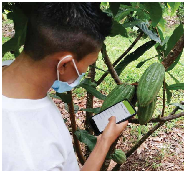
Mediante una aplicación, los productores de cacao acceden a asistencia técnica y a información sobre las distintas etapas del cultivo, entre otros datos útiles.

La gestión sostenible de los recursos naturales, gobernanza hídrica, adaptación al cambio climático y reducción de riesgos a desastres continúa siendo prioritarios para el trabajo en este ámbito. Se refuerzan alianzas con Oficina de las Naciones Unidas para la Coordinación de Asuntos Humanitarios (OCHA) y la Oficina de las Naciones Unidas para la Reducción del Riesgo de Desastres (UNDRR) y socios regionales multilaterales 11 en la arquitectura de proyectos regionales, en una lógica de phasing