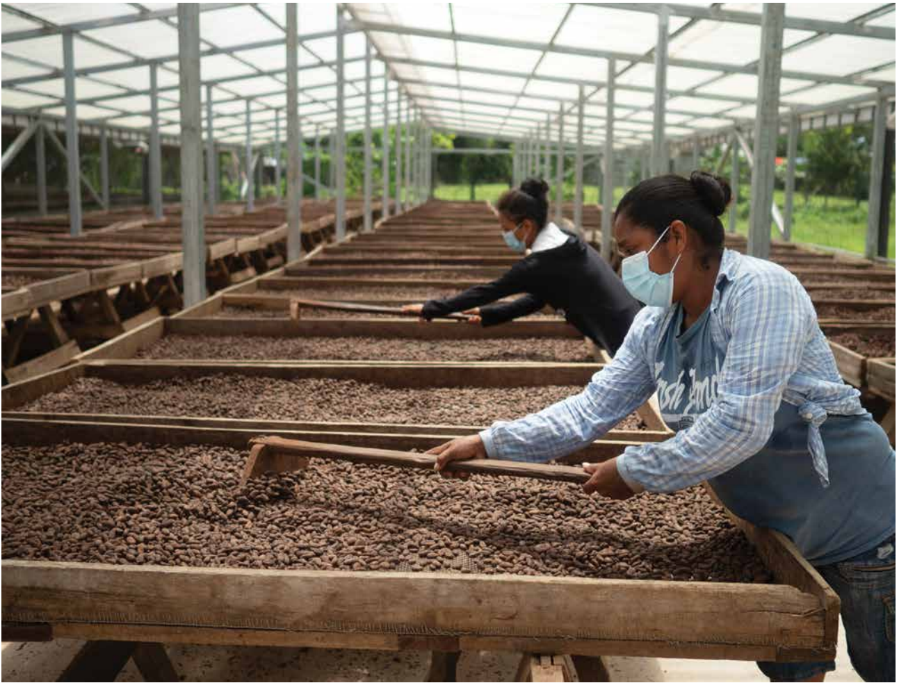
Mujeres participan en la cadena de valor del cacao. Aquí en labores de secado y volteado.

ocupados por mujeres. En Nicaragua, la producción de cacao de las cooperativas priorizadas se duplicó en los últimos dos años y se ha vuelto rentable 9 . En Honduras, se contribuyó a la creación de 14,650 empleos. A nivel regional, se consolidó una plataforma de gestión de la información y del conocimiento de cacao que nutre las políticas públicas nacionales y regionales.