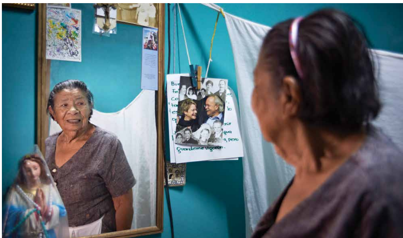
San Marcos, Nicaragua, y Biel/Bienne, Suiza, son ciudades hermanadas desde 1979. La solidaridad siempre ha sido un valor suizo.

beneficiaran de caminos rehabilitados o puentes y que miles viven ahora en condiciones más resilientes ante el constante riesgo de desastres. Parte integral de la cooperación desde los años ochenta ha sido la colaboración con las ONGs, hermanamientos y grupos de la sociedad civil. En todos estos años la Cooperación Suiza ha sido constante en el enfoque en la persona, su empoderamiento y su participación en los procesos de decisión; al mismo tiempo que ha sido versátil en hacer frente a las múltiples formas de fragilidad que perpetúan la pobreza en la región, por lo que se volvió indispensable fortalecer nuevas temáticas, como la buena gobernanza, la lucha contra la corrupción, el fortalecimiento del Estado de derecho y la promoción de los derechos humanos.