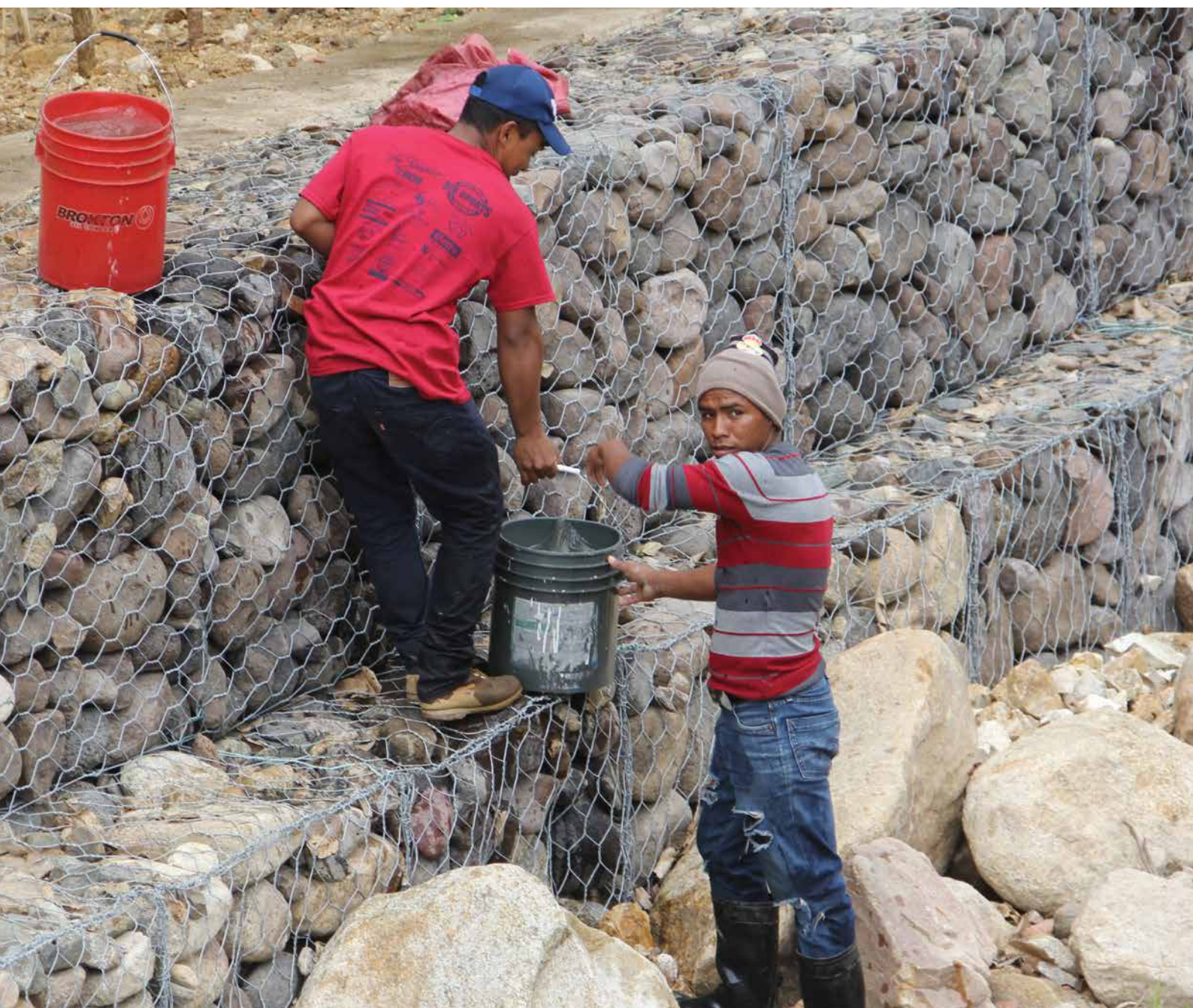
Obras de mantenimiento en afluentes de la Cuenca Dipilto, Nueva Segovia, Nicaragua.