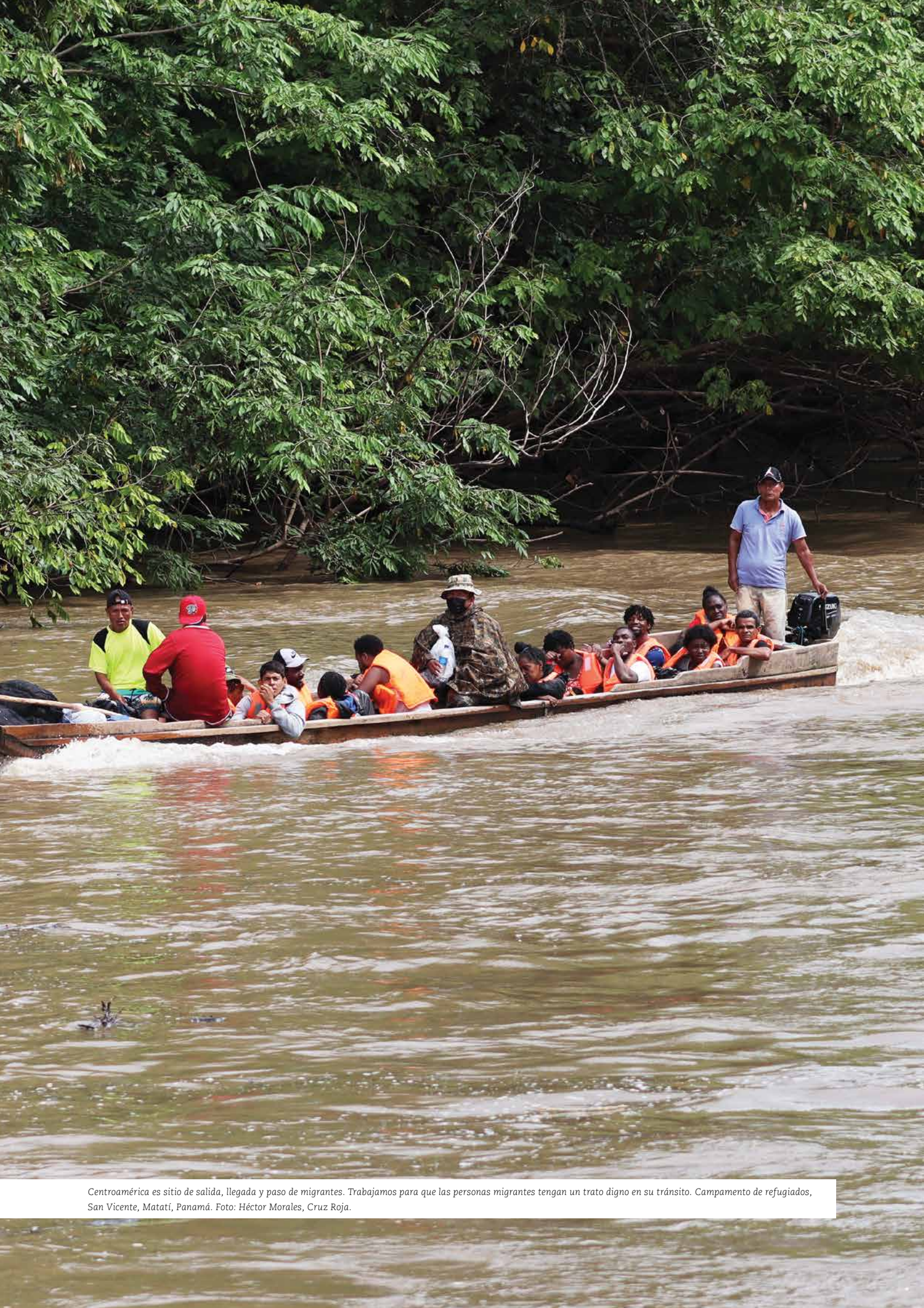
Centroamérica es sitio de salida, llegada y paso de migrantes. Trabajamos para que las personas migrantes tengan un trato digno en su tránsito. Campamento de refugiados, San Vicente, Matatí, Panamá.