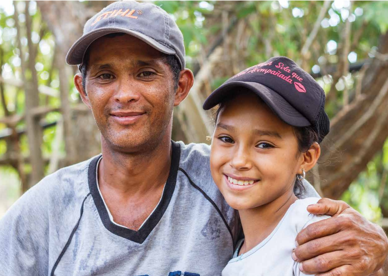
Seguiremos trabajando por empoderar a las personas para que logren cambios tangibles en sus vidas. Confiamos que estaremos a la altura de nuestro legado.