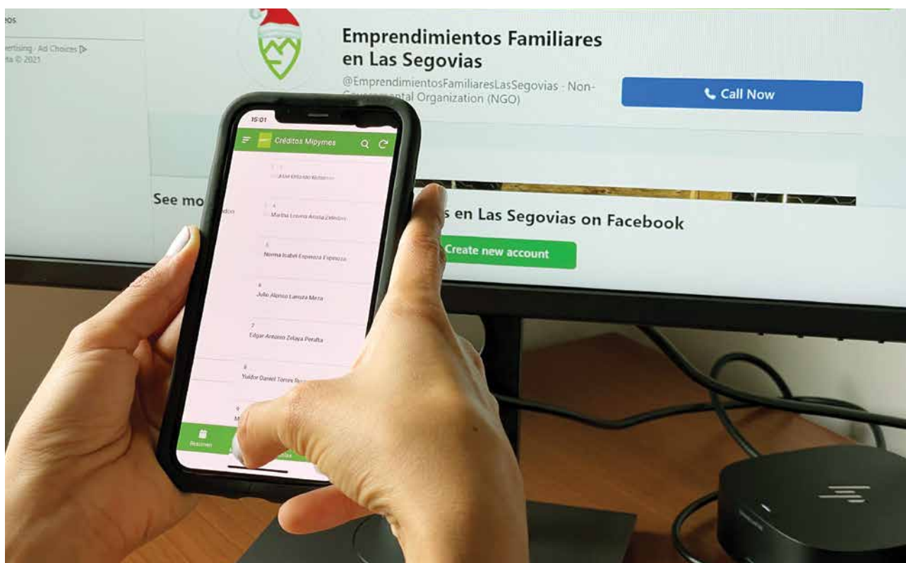
El uso de aplicaciones facilita el monitoreo de los proyectos.

La implementación del programa y el proceso de salida se realiza en comunicación continua con las dos embajadas, la División las Américas y entidades con competencias específicas como los programas globales de COSUDE y la División Paz y Derechos Humanos.