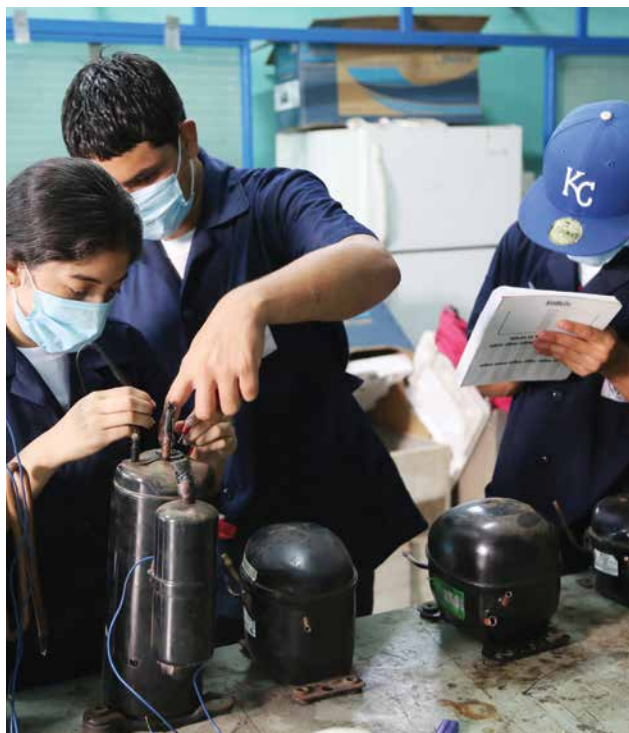
Las juventudes centroamericanas son clave para el desarrollo de la región, por eso están al centro de esta estrategia.

la Agenda 2030 para el Desarrollo Sostenible y los objetivos de la Estrategia de Cooperación Internacional de Suiza 2021-2024 en particular la gobernanza y derechos humanos, el desarrollo económico inclusivo y la adaptación al cambio climático y la gestión sostenible de los recursos naturales . Su acción está orientada por los objetivos de la estrategia de la política exterior de Suiza para 2020-2023 y la Estrategia para la Américas 2022-2025. Se buscará contribuir a responder a las necesidades humanitarias crecientes, así como fomentar la inclusión de grupos vulnerables, la equidad de mujeres y hombres, los derechos humanos y la gobernabilidad democrática. A través de este programa, Suiza contribuye así a su compromiso para mitigar el cambio climático en los países en desarrollo y sus consecuencias.