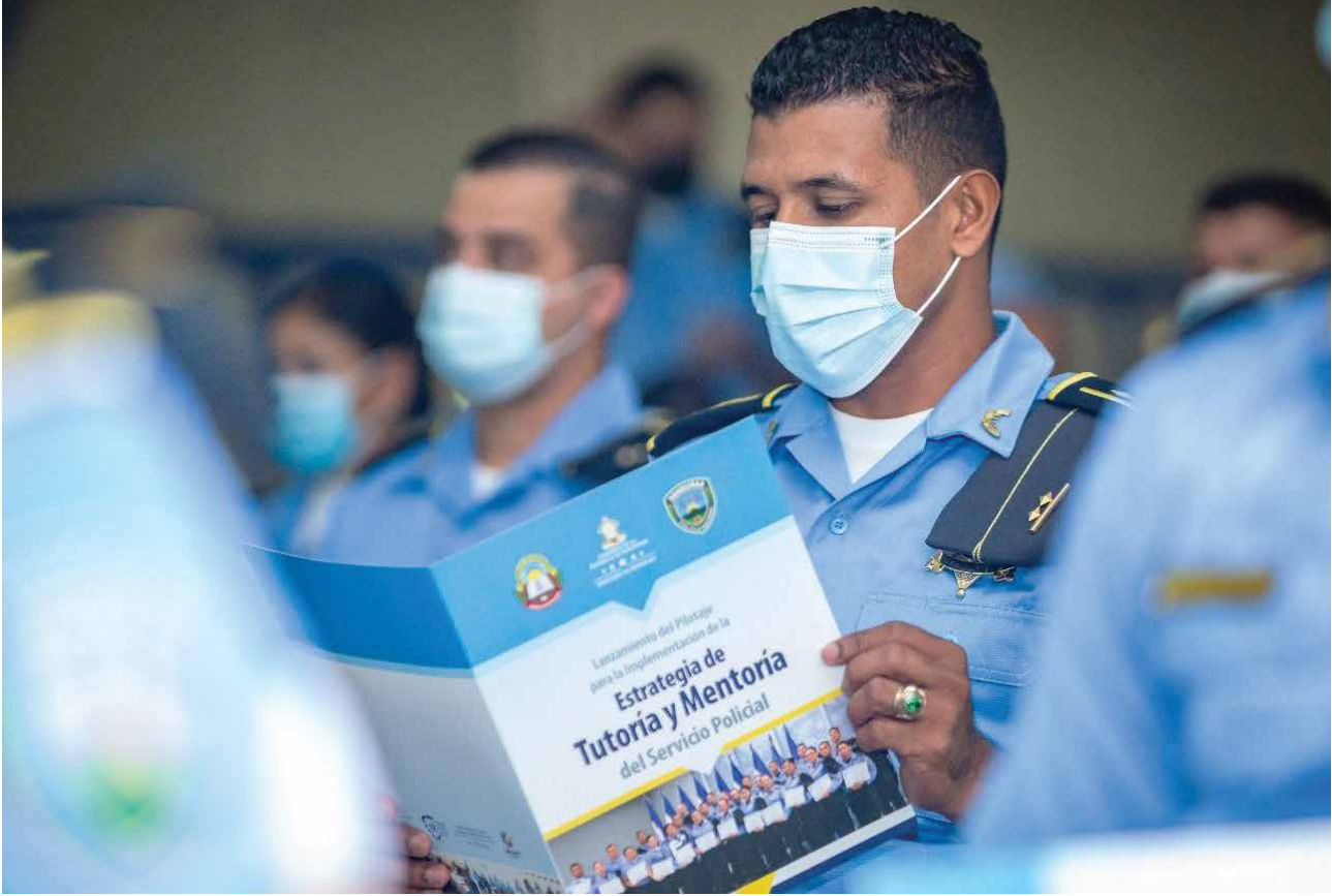
Fuerzas policiales en Honduras reciben apoyo para aumentar su integridad institucional, implementando los principios de meritocracia y adoptando los valores éticos basados en el respeto de los derechos humanos.

cooperación con los ONG Suizas en el marco de la preparación en caso de desastres 12 .