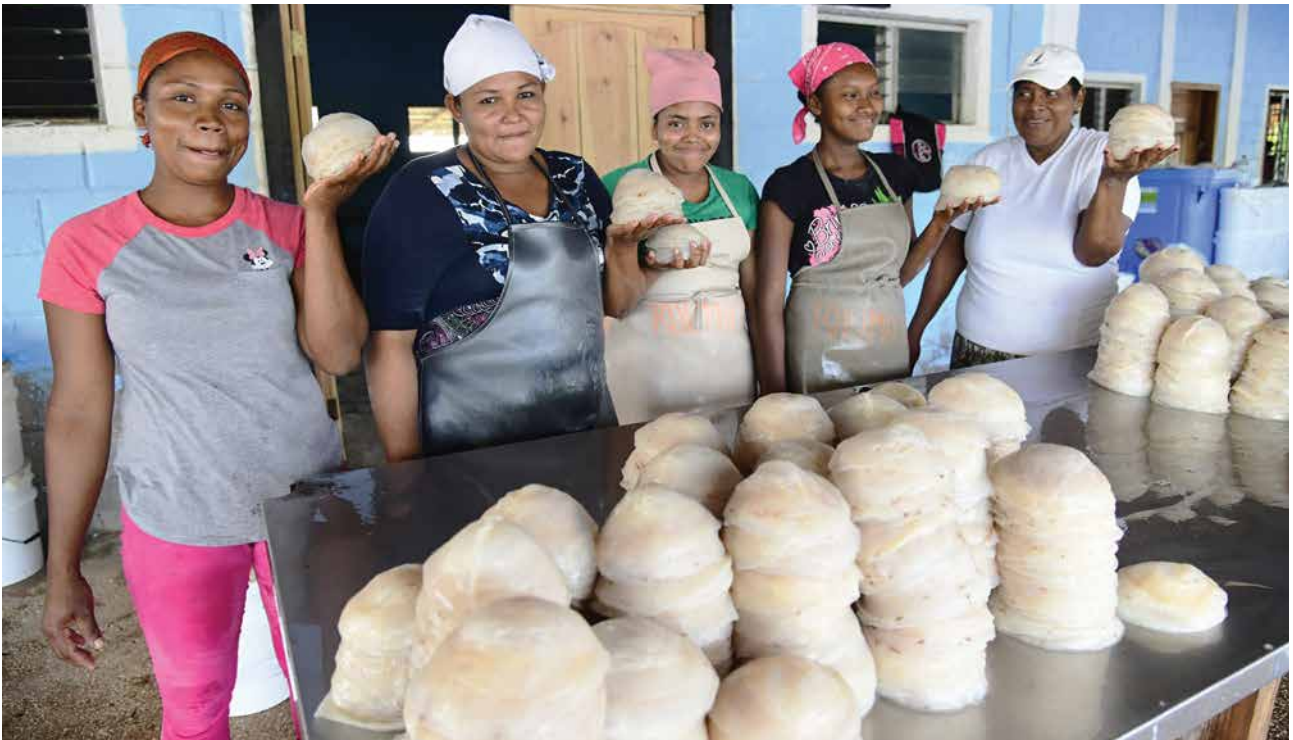
Mujeres de la moskitia hondureña procesan medusa para su comercialización.