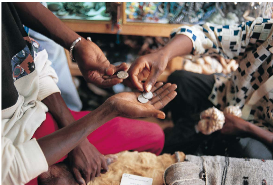
Transaction de monnaie à Mopti au Mali. L'intervention conjointe de la DDC et du comité de crise a permis de faciliter la relance et la reconstruction socio-économique de la région.