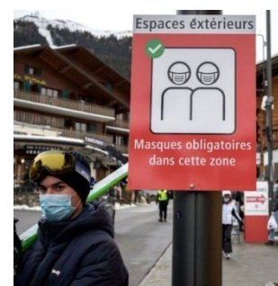
Covid-19: Offene Skigebiete als Schwerpunkt der Berichterstattung