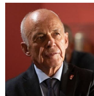
Covid-19: Aussagen von Bundesrat Ueli Maurer werden breit rezipiert