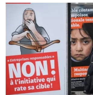
Abstimmungsplakate zur Konzernverantwortungsinitiative