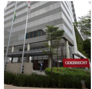
Le Ministère public de la Confédération amende les groupes brésiliens Odebrecht et Braskem.