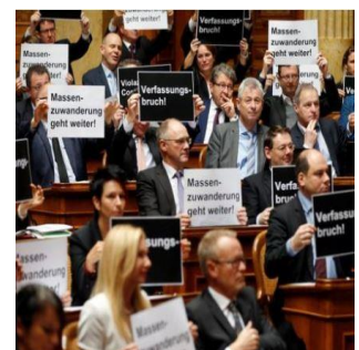
Mise en oeuvre de l'initiative „Contre l'immigration de masse“ au Parlement.

« Switzerland heads for EU immigration climbdown » ( Financial Times )