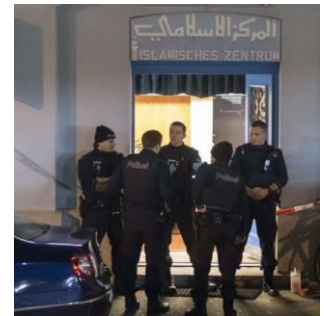
Fusillade dans un centre islamique à Zurich.

« Gunman in Zurich Had No Ties to Terror Groups » ( The New York Times )