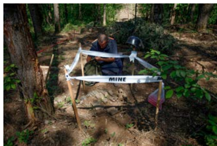
Au travers du projet de déminage en Croatie, la Suisse crée un environnement sûr et protégé pour la population vivant dans les régions infestées de mines.

Les mines et autres restes explosifs de guerre constituent de dangereux vestiges de la guerre qui a fait rage en Croatie de 1991 à 1996. Jusqu'ici, 294 démineurs croates ont nettoyé une surface représentant 1,8 km 2 dans la forêt de Kotar-Stari Gaj, désamorçant 3585 engins explosifs qui dataient de la guerre de Croatie. Selon les estimations, cela devrait représenter environ 10 % du nombre de mines encore enfouies en Croatie. Le projet helvético-croate soutient en outre les victimes et leurs familles en mettant en place des mesures visant à assurer leur réinsertion sociale et économique, ainsi qu'une banque de données nationale permettant d'analyser leurs besoins.