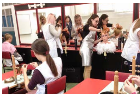
La modernisation de la formation professionnelle améliore l'employabilité des jeunes.