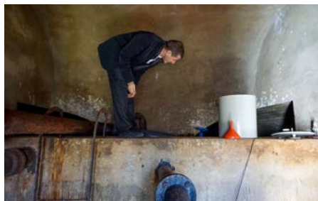
Dans la commune croate de Fužine, un expert suisse inspecte le réservoir d'eau potable datant de 1960.

Dans de nombreuses régions de Croatie, la vétusté du réseau d'approvisionnement en eau potable génère des taux de déperdition élevés. En outre, le pays a un important retard à combler en ce qui concerne la construction de systèmes d'épuration des eaux usées domestiques. De nombreux habitants collectent aujourd'hui leurs eaux usées dans des fosses septiques. Il s'agit soit de fosses septiques en béton enfouies dans le sol soit de simples fosses en terre, qui sont régulièrement vidangées. Dans la région de Gorski kotar, dans le nord-ouest de la Croatie, la Suisse soutient de ce fait les communes de Delnice, de Fužine et de Brod Moravice dans la construction et la réhabilitation d'infrastructures d'eau et d'assainissement. Les travaux de construction ont débuté après la réalisation des études de faisabilité, des rapports d'impact sur l'environnement et des appels d'offres.